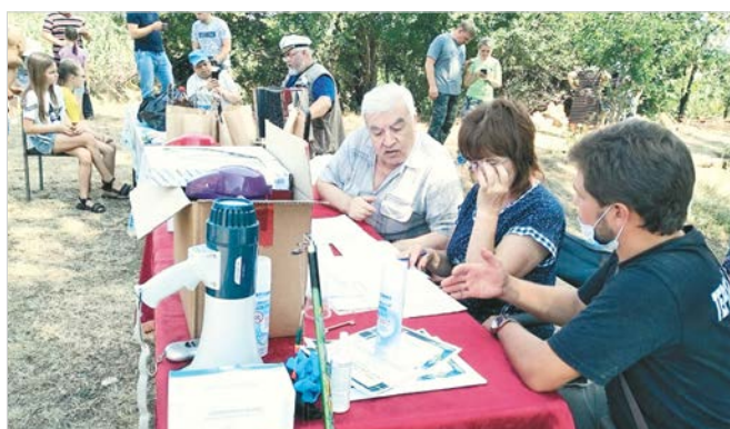
Судьи за работой.