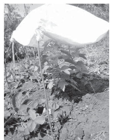
Молодой куст смородины спрятан от вредного солнца.