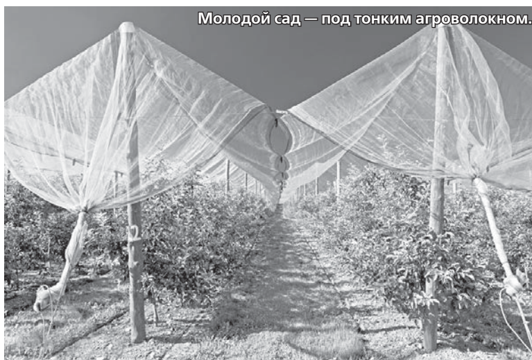
Молодой сад — под тонким агроволокном.

В самый жаркий летний период многие дачники сталкиваются с тем, что на некоторых растениях - и огородных, и садовых - начинают сохнуть листья. Причем это происходит быстро и без видимых проблем: признаков болезни и вредителей нет. Причина такого явления - неблагоприятное воздействие солнечных, а точнее, ультрафиолетовых лучей.