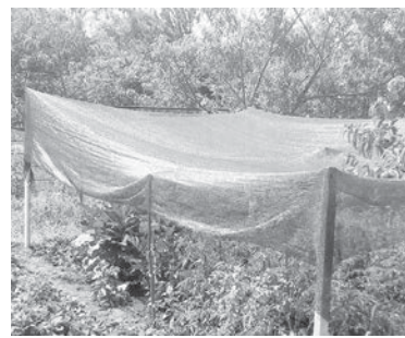
Навес из затеняющей сетки.

дельных кустарников можно соорудить небольшой навес или шалашик, накрыв каркас простой светлой тканью.