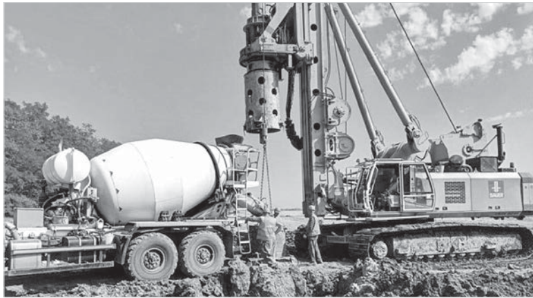
Стройка Кармалиновской ВЭС.

На сайте pmisk.ru завершилось голосование за предложения граждан, поступившие в рамках реализации краевой программы поддержки местных инициатив. Более 9 тысяч жителей Ставрополя отдали свои голоса путем электронного голосования. А в небольших населенных пунктах еще продолжаются подомовые обходы, люди голосуют за приоритетные проекты в своих территориях. Конкурсный отбор проектов состоится 15 сентября, по его результатам и станет известно, какие народные инициативы будут реализованы в 2021 году.