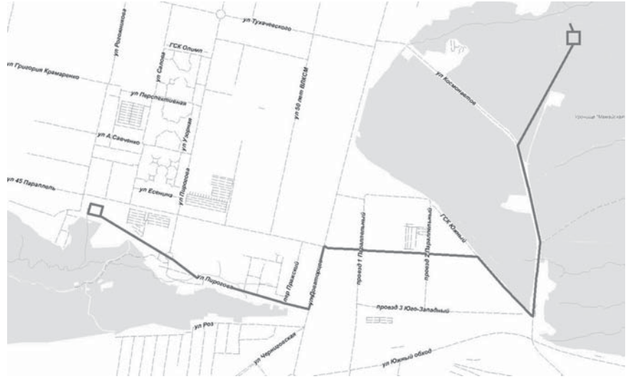
СХЕМА границ территории подготовки документации по планировке территории (проекта планировки территории, проекта межевания территории) в границах улицы Космонавтов от земельного участка с кадастровым номером 26:12:031401:5, по проезду 2 Юго-Западному, улице Доваторцев, улице Пирогова до земельного участка с кадастровым номером 26:12:012001:1265 города Ставрополя

Описание границ территории подготовки документации по планировке территории (проекта планировки территории, проекта межевания территории) в границах улицы Космонавтов от земельного участка с кадастровым номером 26:12:031401:5, по проезду 2 Юго-Западному, улице Доваторцев, улице Пирогова до земельного участка с кадастровым номером 26:12:012001:1265 города Ставрополя в целях строительства линейного объекта (канализации) «Строительство канализационной насосной станции, напорной канализационной линии и очистных сооружений канализации в Промышленном районе города Ставрополя»: