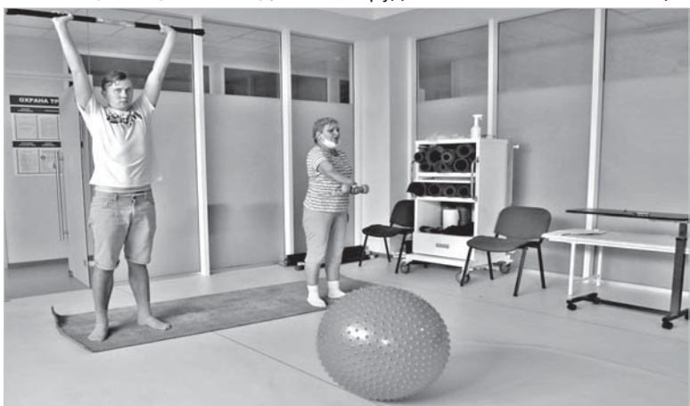
Занятия лечебной физкультурой.