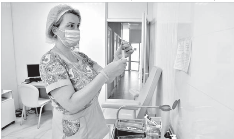
В процедурном кабинете.

ВОЗМОЖНЫ ПРОТИВОПОКАЗАНИЯ. НЕОБХОДИМА КОНСУЛЬТАЦИЯ СПЕЦИАЛИСТА.