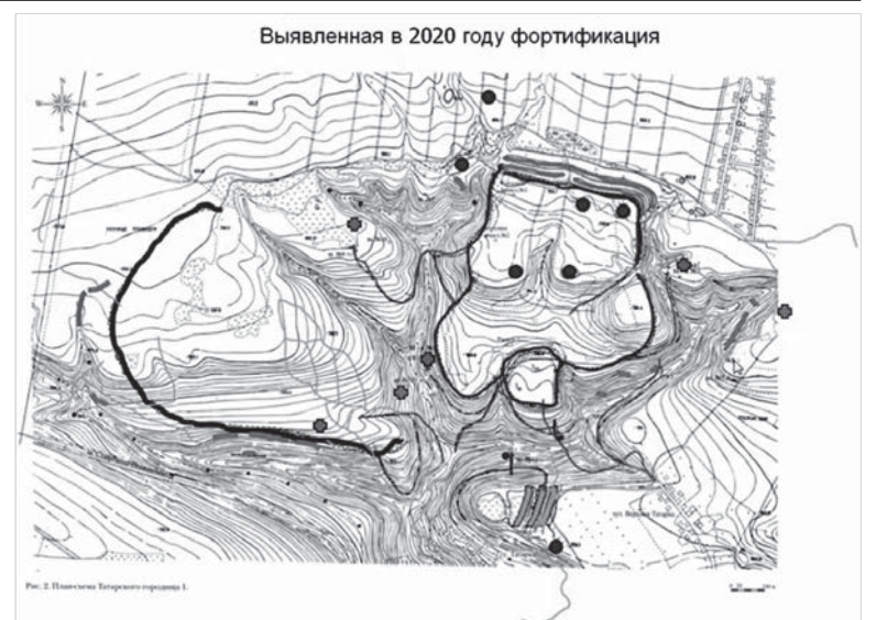
В ходе археологической разведки на Татарском городище были выявлены новые объекты.