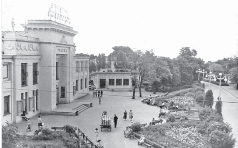
Кинотеатр «Родина». 1961 год.

вых и до последних дней войны был в боевом строю защитников Родины. В основу повествования легли документы архивного отдела и военных архивов, размещенные на сайте «Подвиг народа». Посетители страницы архивного отдела и пользователи сети Instagram могли ознакомиться с виртуальными историко-документальными выставками «Военная летопись города Ставрополя в архивных документах» и «Этот День