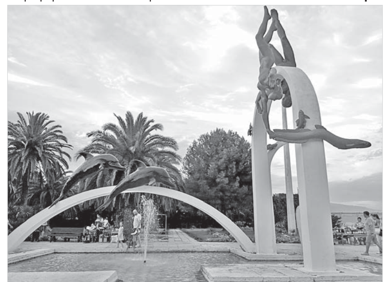
Скульптурная композиция «Море».