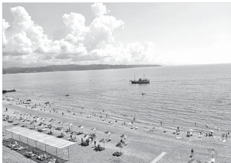
Теплоход «Герой Абхазии».

Маски, перчатки и антисептики – неперенные спутники практически каждого жителя нашей планеты в последние месяцы. Но пандемия пандемией, а отпуск никто не отменял. И если кто-то решил пересидеть это непонятное время дома, то другие все же рискнули отправиться в путешествие, понимая, что иначе не получится полноценного отдыха, после которого можно вернуться на работу с новыми силами и идеями.