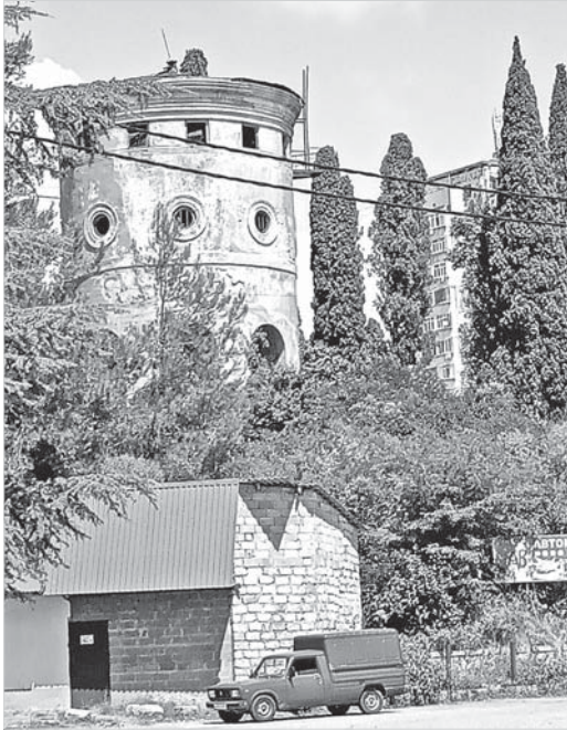
Старая водонапорная башня, памятник промышленной архитектуры.