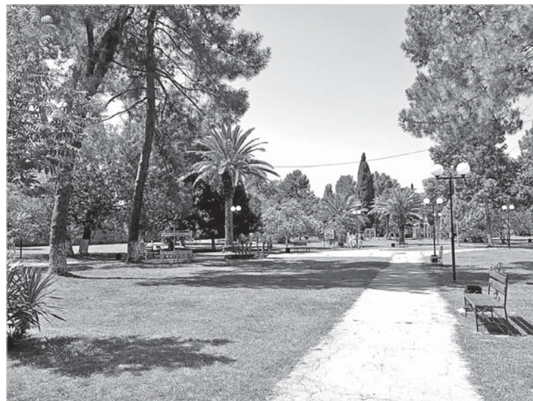
У Патриаршего собора в Пицунде раскинулся субтропический сквер.

В сочетании же с чистейшей водой Пицундской бухты оздоро-