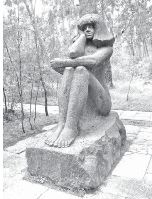
«Каменная девушка» на набережной.