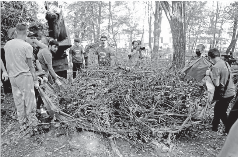
Идет уборка скопившегося за лето мусора.

тоем. Результаты общего труда были столь очевидны, что было решено ввести подобные мероприятия на городских некрополях в систему. Так и родился проект, получивший название «Чистая память». Его поддержали губерна-