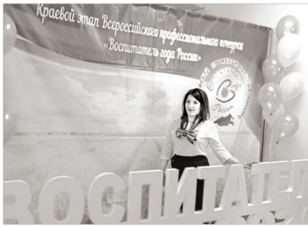
титута развития образования, повышения квалификации и педагогики работников образования состоялся третий (очный) тур конкурса. Лауреаты конкурса представили свои проекты в конкурсном испытании «Доклад-презента-

10 сентября на базе Ставропольского краевого ин-