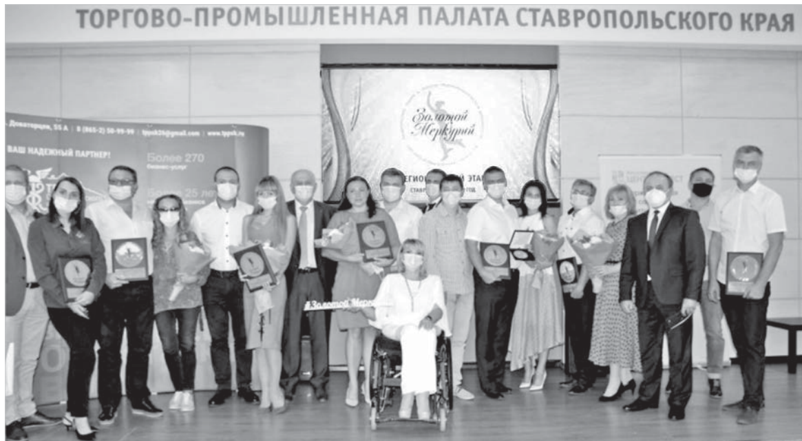
Победители регионального этапа национальной премии «Золотой Меркурий».

Торгово-промышленная палата Ставропольского края – организация многопрофильная. Мы оказываем 18 видов различных услуг. В период пандемии значительный спад мы наблюдали в процессе выдачи сертификатов гостиницам и санаториям. Сейчас мы возобновляем этот процесс, входим в