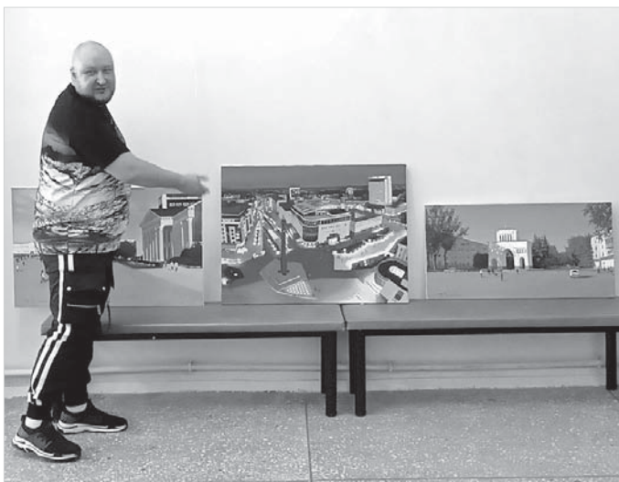
Эти пейзажи Василия Молокова зрители увидят на выставке.