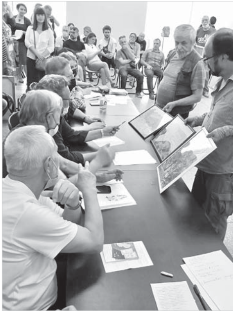
Участники выставкома за работой.

У ставропольских художников есть давняя добрая традиция – к Дню города и края готовят масштабные выставки. Нынешний год, несмотря на ограничения, связанные с пандемией, к счастью, не стал исключением. В Ставропольском отделении Союза художников РФ решили посвятить экспозицию 30-летию нашей газеты и назвали её – «Вечерний Ставрополь».