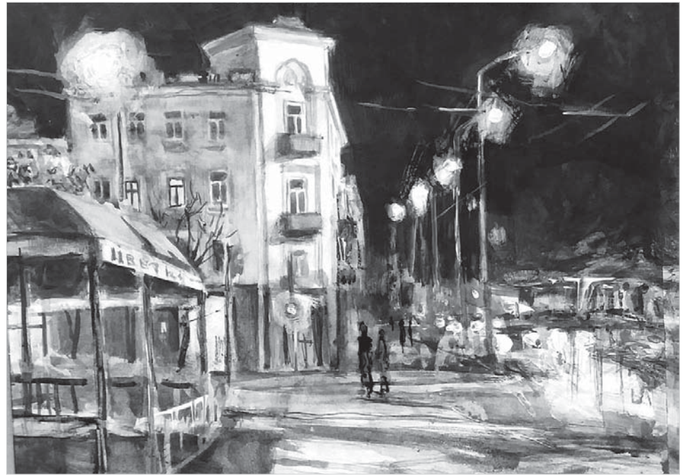
В. Поляков. Вечерний Ставрополь.