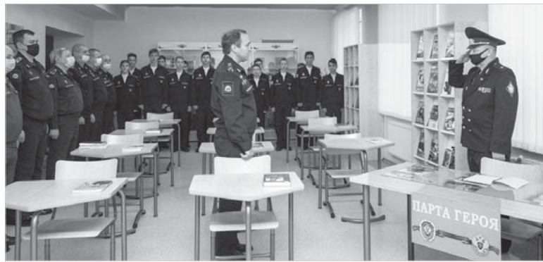
Открытие парты Героя.

В прошлые годы в этот декабрьский день проходили встречи с офицерами, удостоенными высшей государственной награды, проходили концерты, на территории разворачивался «музей военной техники». В 2020 году, естественно, многое пришлось корректировать, но День Героев ребятам запомнился.