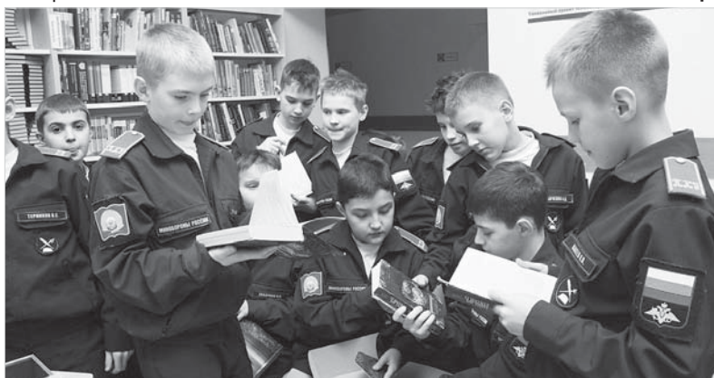
Кадеты получили в подарок книги о великой битве за Москву.