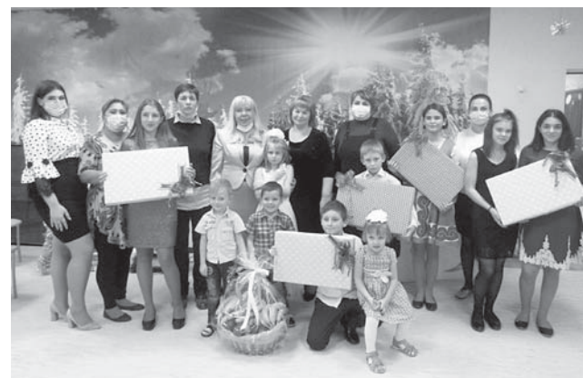
Подарки детям из Степновского социально-реабилитационного центра для несовершеннолетних от Фонда имени Е.М. Примакова и ТПП СК.

- Способность сострадать, протягивать руку помощи тем, кому она особенно нужна, – отличительная черта наших сограждан. Сотрудники ТПП СК – не исключение. Вместе с благотворительным фондом имени Е.М. Примакова мы в ушедшем году вручили подарки трём детским домам – Степновскому и Андроповскому социально-реабилитационным центрам для несовершеннолетних и государственному казенному учреждению для детей-сирот и детей, оставшихся без попечения родителей, «Детский дом №15 «Надежда». Мы привезли ребятам всё то, чего им реально не хватало – ноутбуки, проекторы, экраны и другую технику. Безусловно, рассказали о Евгении Примакове, Фонде и нашей палате. Конечно, такие встречи всегда мотивируют на более внимательное отношение к детям и заботе о них.