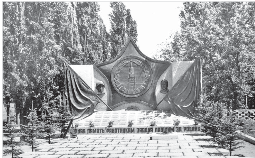
Памятник работникам Ставропольского завода «Красный металлист», погибшим в годы Великой Отечественной войны. Май 1975 года.