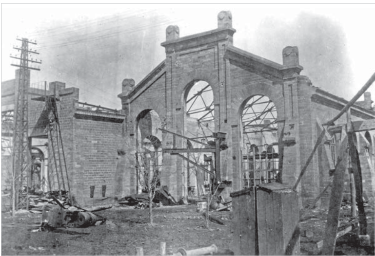
Цеха Ставропольского завода «Красный металлист», разрушенные немецко-фашистскими захватчиками. Март 1943 года.