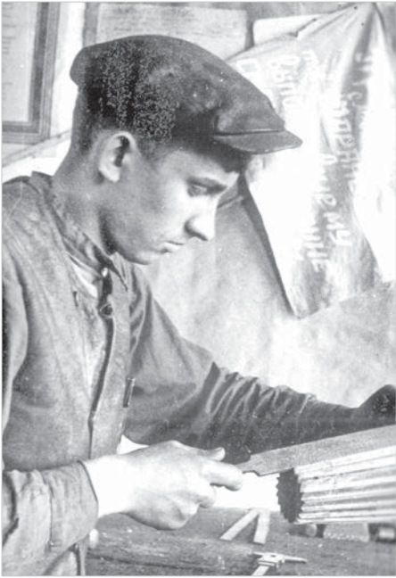
Слесарь завода, выполнявший дневную норму на 518%. 1944 год.