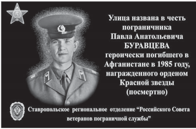
Мемориальная доска установлена на улице Ставрополя, носящей имя Павла Буравцева.