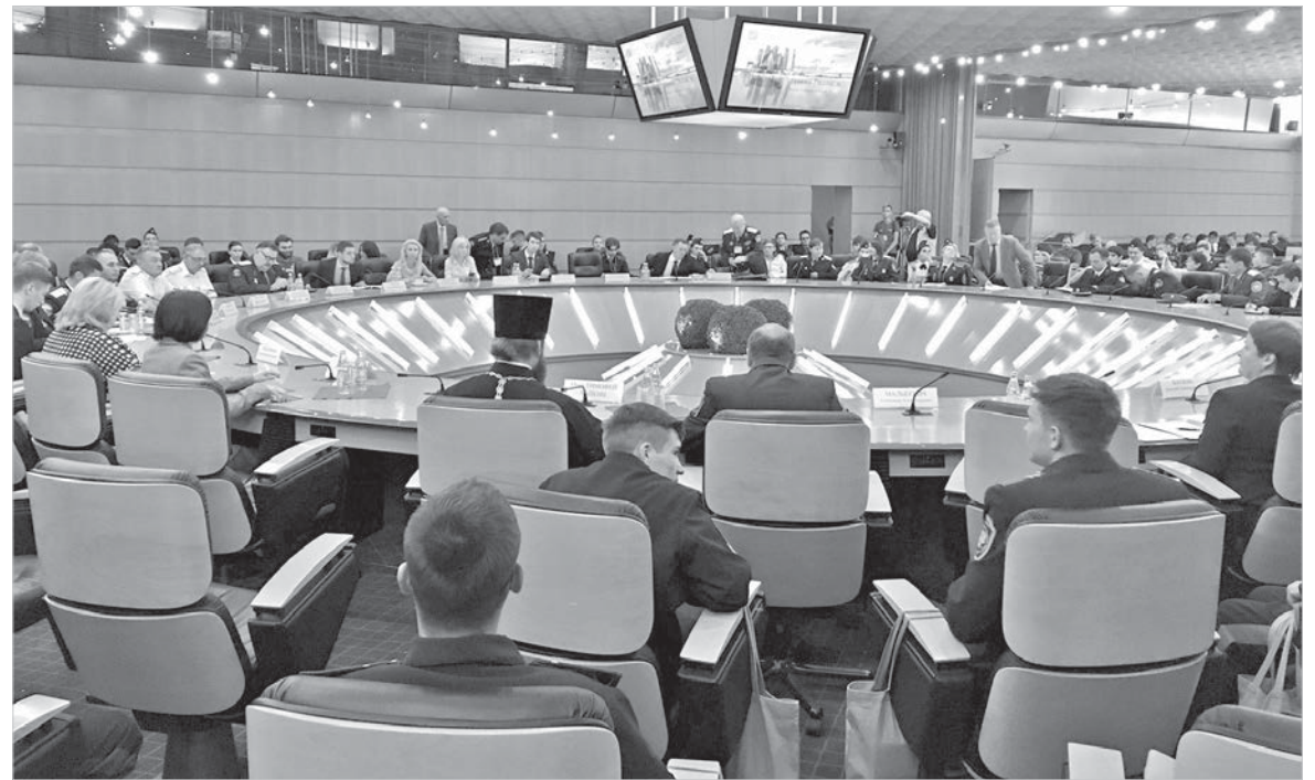
Фото комитета по делам национальностей и казачества.

Также оба проекта терцев занесены в список рекомендованных для вузов, молодежных казачьих организаций и казачьих военно-патриотических центров по всей стране.