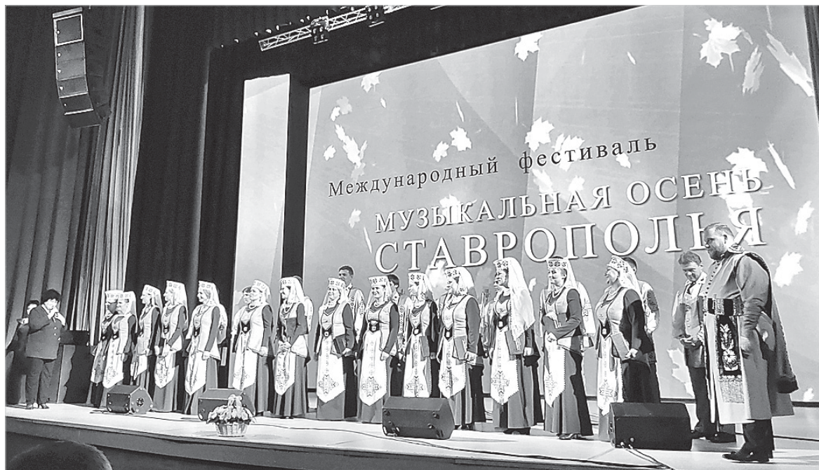
На сцене ДДТ – Архиерейский хор Свято-Духова кафедрального собора Минска.