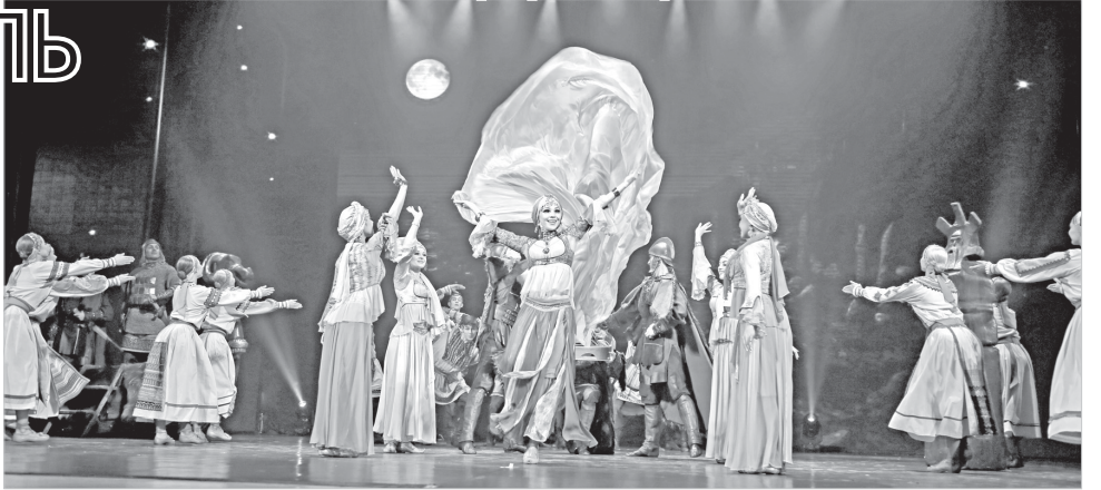
52-я «Музыкальная осень Ставрополя» завершилась выступлением Русского национального балета «Кострома».

Русский национальный балет «Кострома» в этом году отмечает свое 30-летие. За это время сложился творческий почерк коллектива, узнаваемый стиль его программ. В этом большая заслуга основате-