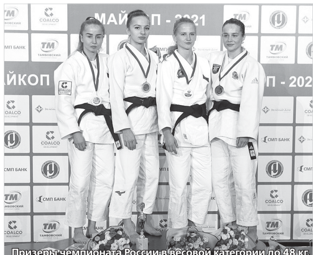
Призеры чемпионата России в весовой категории до 48 кг.

Участие в нем приняли 526 спортсменов – 328 мужчин и 198 женщин из всех регионов России.