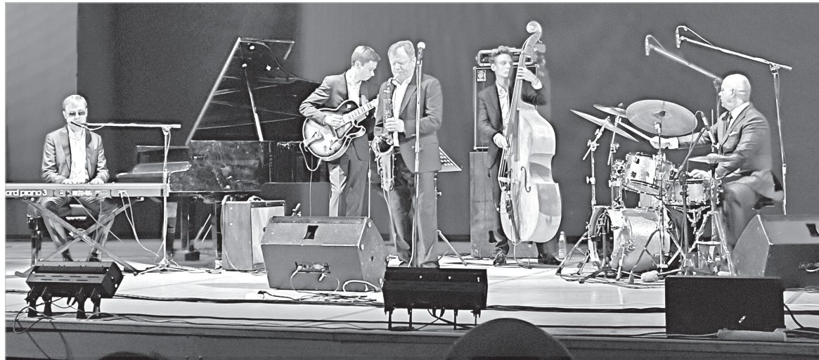
Джаз-квинтет Игоря Бутмана на сцене Ставропольского Дворца детского творчества.