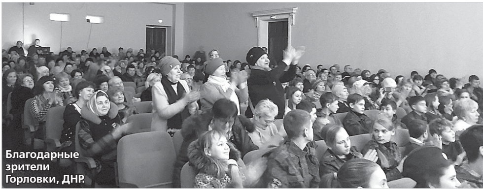
Благодарные зрители Горловки, ДНР.