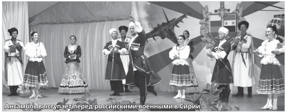
Ансамбль выступает перед российскими военными в Сирии.