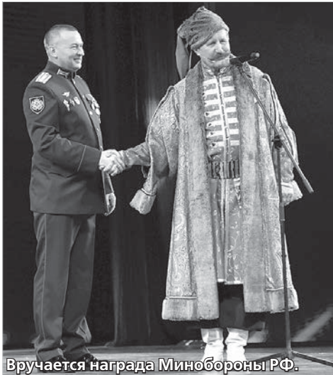
Вручается награда Минобороны РФ.