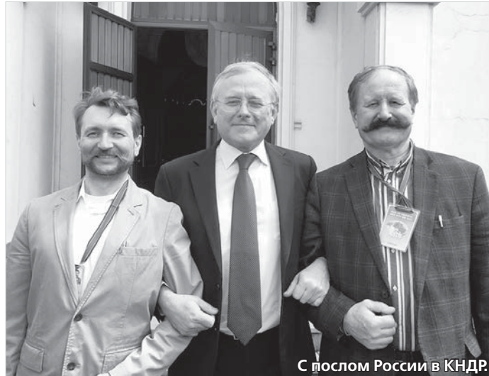
С послом России в КНР.