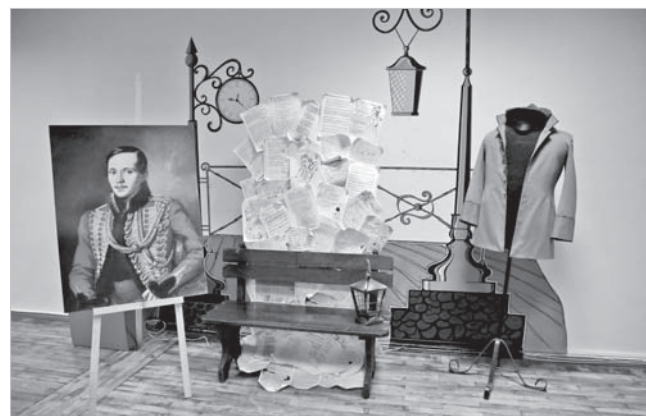
Лермонтовская фотозона в Центральной городской библиотеке.