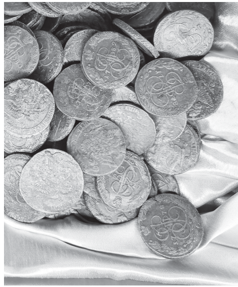
Клад пятикопеечных монет XVIII века, найденный на Ставрополье в 1969 году, хранится в Ставропольском музее-заповеднике.

История денег неразрывно связана с историей стран и народов. На выставке посетители узнают интересные факты «денежной жизни». К примеру, то, что первые золотые монеты в России были отчеканены в 1755 году из уральского золота, а в 1828 году первые в мире платиновые монеты появились именно в Российской империи.