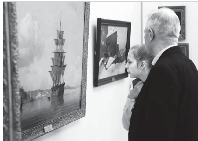
Посетители на новой выставке из «золотого фонда».