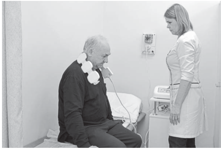
В комплексе реабилитационных мероприятий — физиопроцедуры.

Минздравом России определены приоритетные категории населения, переболевшие COVID-19, которым показана углубленная диспансеризация. Это перенесшие коронавирусную инфекцию в состоянии средней тяжести и имеющие сопутствующую патологию, так называемые коморбидные состояния, когда у человека одновременно протекают два и более заболеваний. Диспансеризация предусматривает два этапа. На первом, помимо основного набора ис-