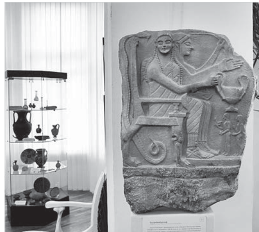
В большом выставочном зале музея изобразительных искусств.