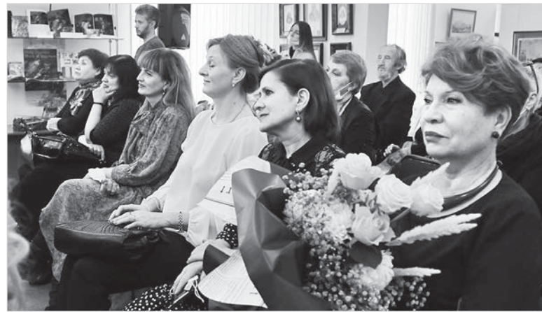
В зале – друзья музея.