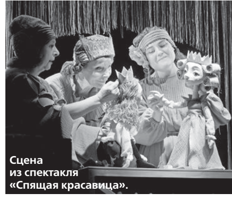
Сцена из спектакля «Спящая красавица».