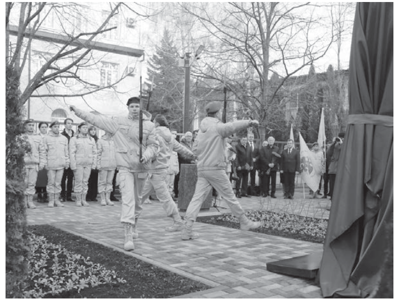
В почетном карауле — Юнармия.