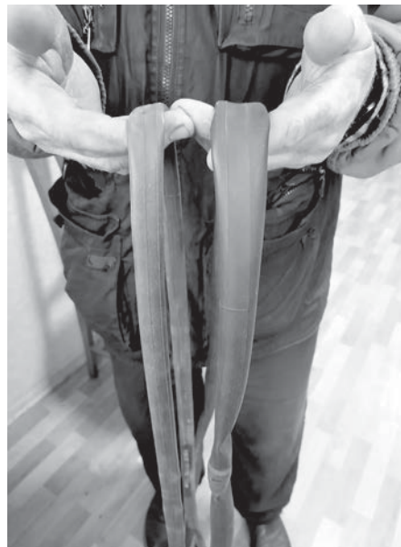
Размер установленной камеры (слева) явно не соответствует «родной».