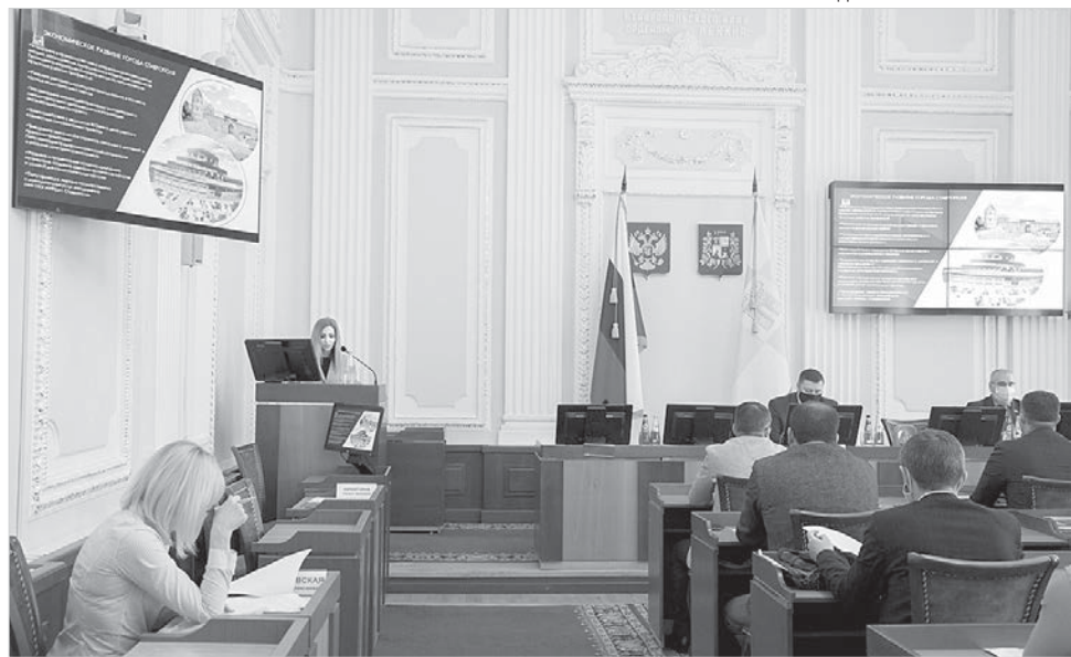
Публичные слушания в Ставропольской городской Думе.

уделяется устранению дефицита современных учреждений культуры, развитию социальной инфраструктуры, созданию парков, формированию имиджа Ставрополя как города, открытого для свободного творческого самовыражения.