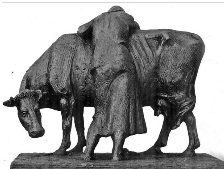
Н. Санжаров. «Вдова». 1967 г.