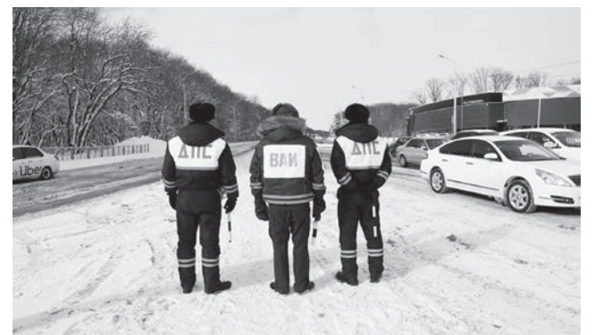
ГИБДД и ВАИ работают в тесном взаимодействии.

«Если раньше нарушения ПДД среди военных водителей встречались чаще, то сегодня это довольно редкие, даже, можно сказать, исключительные случаи, потому что военная дисциплина играет свою решающую роль», – рассказали сотрудники ВАИ.