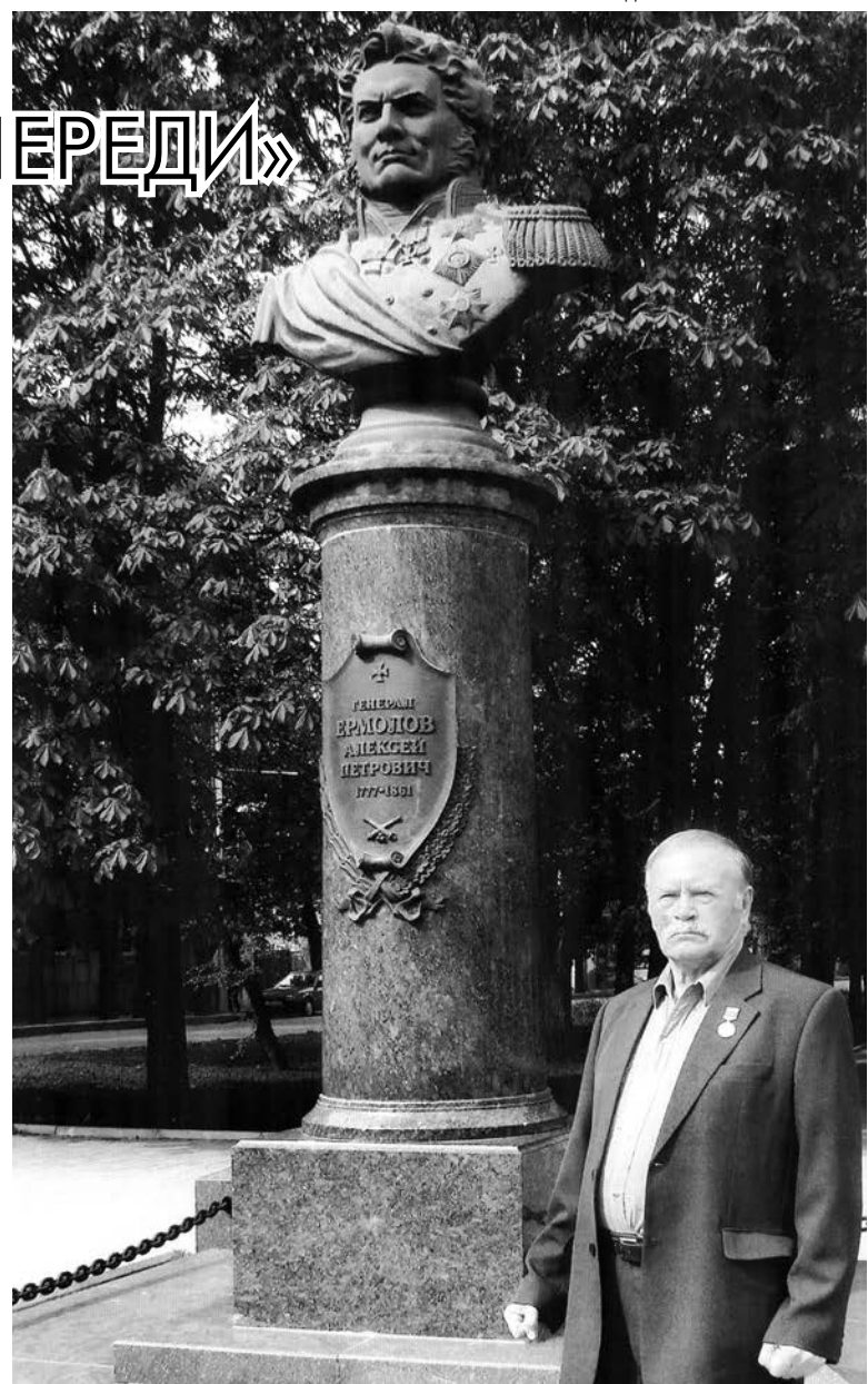
Автор и его работа – памятник-бюст герою Отечественной войны 1812 года генералу А.П. Ермолову в Ставрополе.

Тема героического прошлого, мужества и патриотизма стала