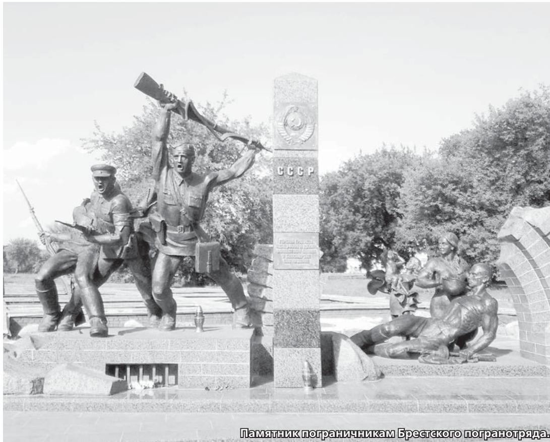
Памятник пограничникам Брестского погранотряда.

Нельзя не вспомнить и еще одного человека, который в 60-е годы прошлого века в своей небольшой книге «Первые залпы», увековечил подвиг 2-й заставы.