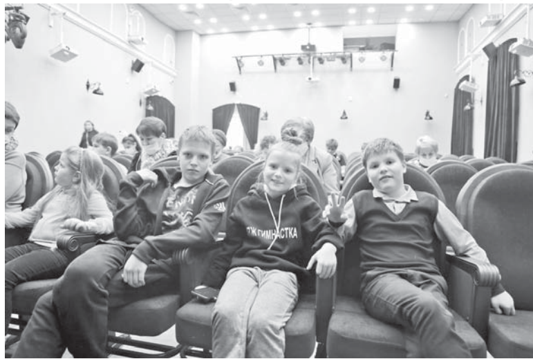
В зале – юные зрители.