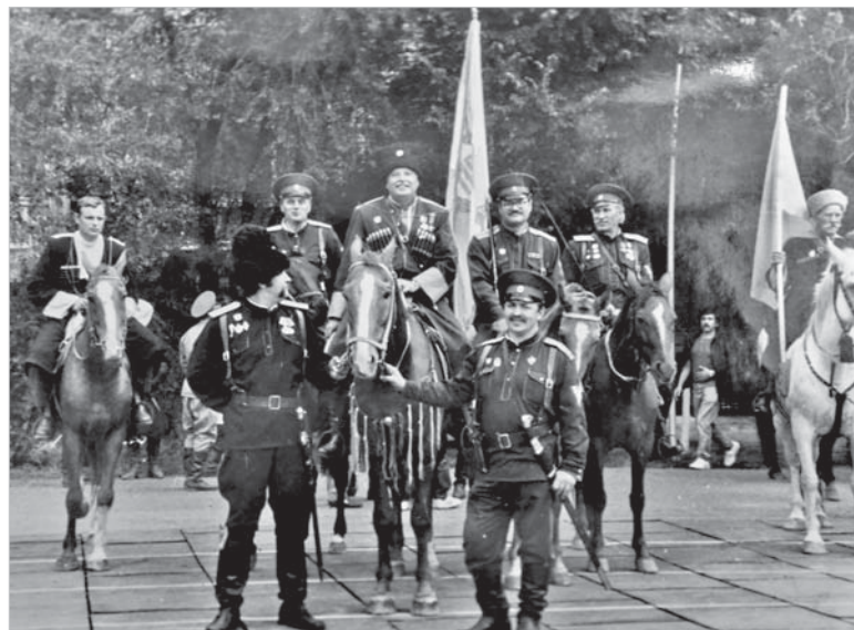
Ставропольский городской Союз казаков в Георгиевске. 1992 год.

на учредительном круге 2 февраля 1991 года. Музей, который и сегодня работает на базе краевого казачьего Центра, собран большей частью его усилиями. У него и следующего атамана Виктора Аксенова, избранного в 1994 году, было еще одно важное качество — они обладали особым талантом сплачивать, объединять казаков. В день престольных праздников заказывались автобусы, и казаки вместе со своими семьями — старыми и малыми — были в церкви, а потом праздновали — вот так сообща, по-семейному. Возрождение традиций, сохранение истории, восстановление утраченного — все это было и остается приоритетом в работе казачьего общества.