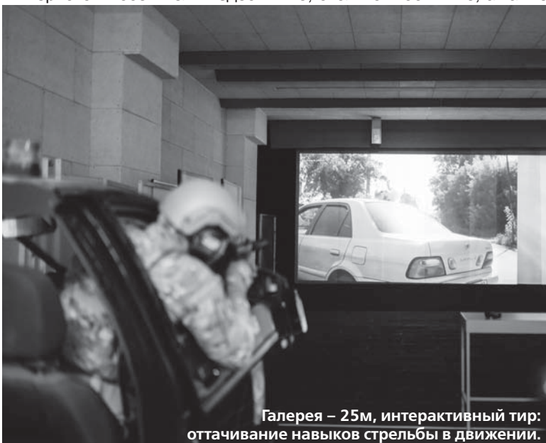
Галерея – 25м, интерактивный тир: оттачивание навыков стрельбы в движении.

В галерее очень много специальных мишеней с различными зонами попадания, выполняемых из брони гонгов, попперов, тарелок, передвижных ширм. В классической мишени для практической стрельбы нет привычных разделений на цифровые секторы, а существует три специальные зоны, за попадание в которые начисляются очки – пять, три и одно. Окончание на 14-й стр.