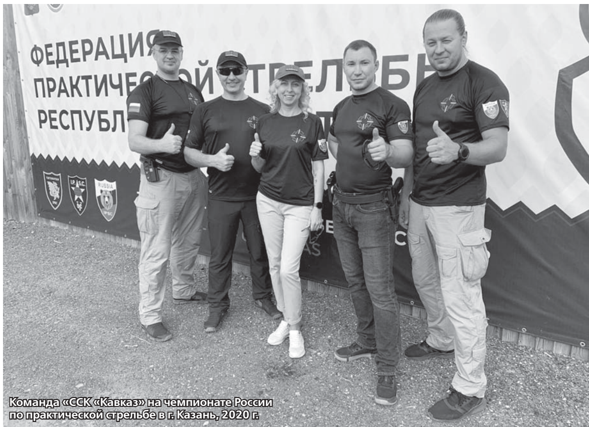
Команда «ССК «Кавказ» на чемпионате России по практической стрельбе в г. Казань, 2020 г.

В стометровой галерее можно заниматься пулевой стрельбой классического направле-