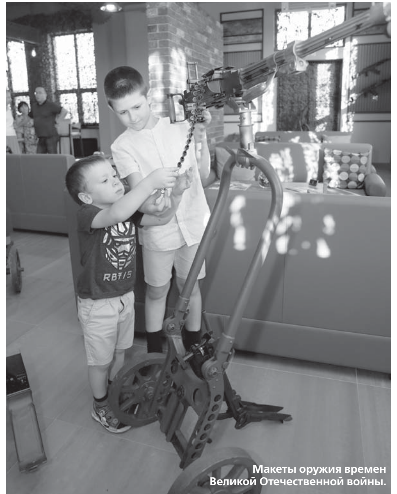
Макеты оружия времен Великой Отечественной войны.

Проанализировав всё изложенное, приходишь к выводу,