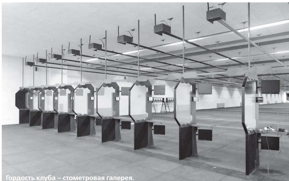
Гордость клуба – стометровая галерея.