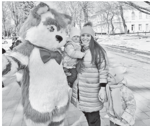
Цветы и праздничное настроение – от артистов театра кукол.

ми и любимыми и на несколько часов перенеслись в мир детства и волшебства.