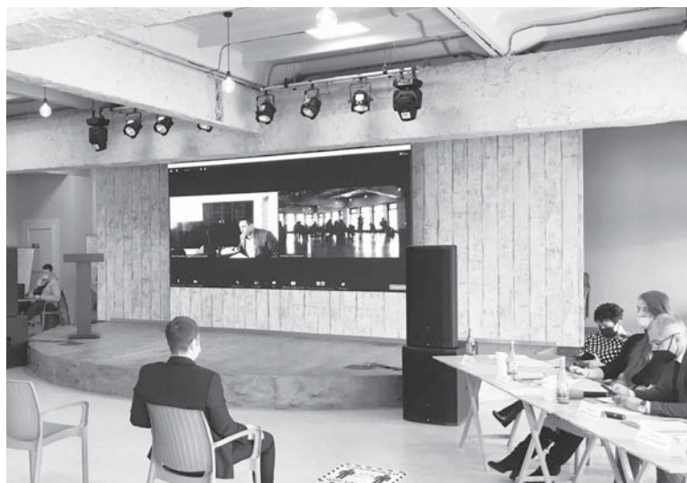
Выступление представителей налоговой инспекции в режиме онлайн.

С 6 августа этого года предприниматели ждёт ещё одна новость не из разряда приятных. Именно после этой даты можно будет регистрировать кассы только с новыми фискальными накопителями, поддерживающими работу с налоговыми документами последней версии. Это связано с необходимостью отслеживания маркированного товара. Список тех изделий, которые нуждаются в маркировке, утверждается постановлением Правительства России. В него периодически вносятся изменения, расширяющие перечень. В настоящее время к товарам, ко-