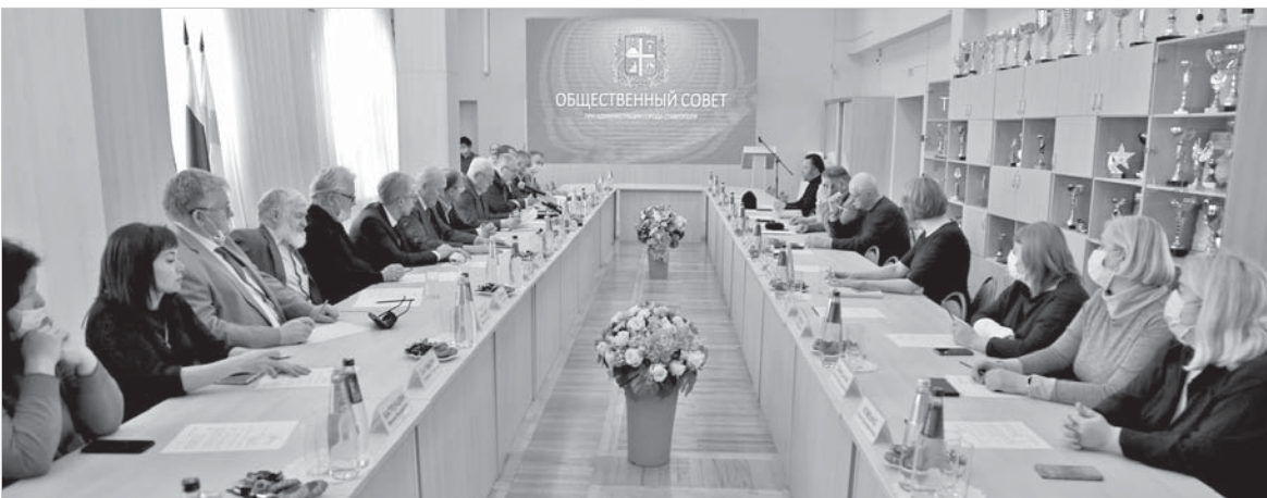
В Ставрополе состоялось первое в нынешнем году заседание Общественного совета при администрации города.