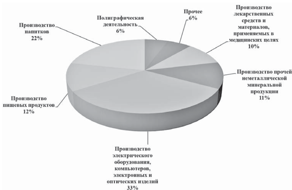
Рисунок 1. Структура промышленности города Ставрополя по итогам 2019 года

Общая характеристика ситуации. Промышленное производство города Ставрополя характеризуется высоким потенциалом и многоотраслевой структурой. На протяжении последних лет в производстве промышленных видов продукции наблюдается положительная динамика. Ежегодный объем отгрузки продукции крупными и средними организациями на территории города Ставрополя по промышленным видам деятельности превышает 30 млрд рублей. В городе Ставрополе выпускаются мясные и колбасные изделия, консервы, молоко и молочные продукты, сыры, растительное и животное масло, мука, хлеб и хлебобулочные изделия, кондитерские изделия, алкогольные и безалкогольные напитки, более 20 процентов в структуре промышленного производства города занимает производство напитков. Более 30 процентов промышленного производства приходится на производство электрооборудования, электронного и оптического оборудования. Среди выпускаемой продукции – счетчики электрической энергии, зарядных устройств, систем управления технических средств судов, систем защиты от электрохимической коррозии, измерительных инструментов, различные виды радиоэлектронной аппаратуры. Структура промышленности города Ставрополя по итогам 2019 года представлена на рисунке 1.