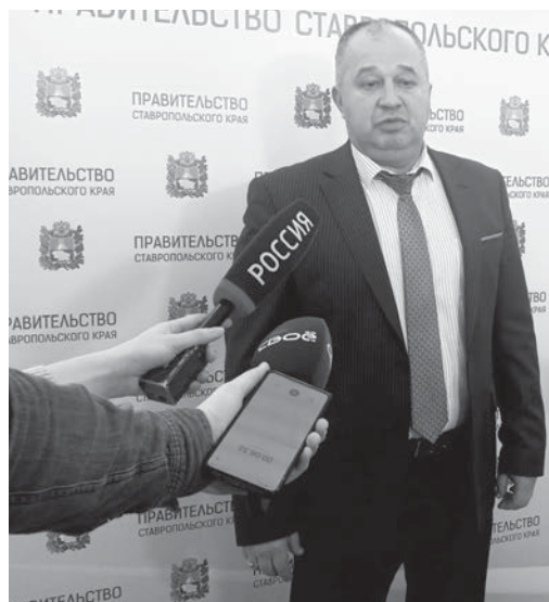
И.о. министра дорожного хозяйства и транспорта СК Евгений Штепа.

Помимо того, сегодня министерство плотно работает с ГИБДД по контролю за действующими перевозками на предмет их безопасности для пассажиров. К сожалению, замечаний по поводу различных нарушений более чем достаточно, поэтому будут рас-