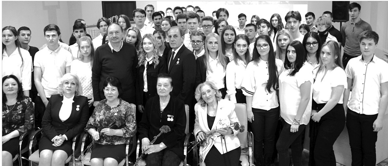
Участники открытого урока «Трудом прославлявшие Родину. Герои Труда – гордость страны и Ставропольского края».