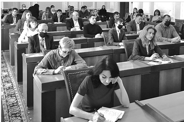
Сессия для ставропольских экспортёров прошла в зале заседаний Ставропольской городской Думы.