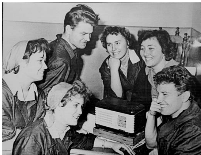
Наши земляки 60 лет назад — радость одна на всех.