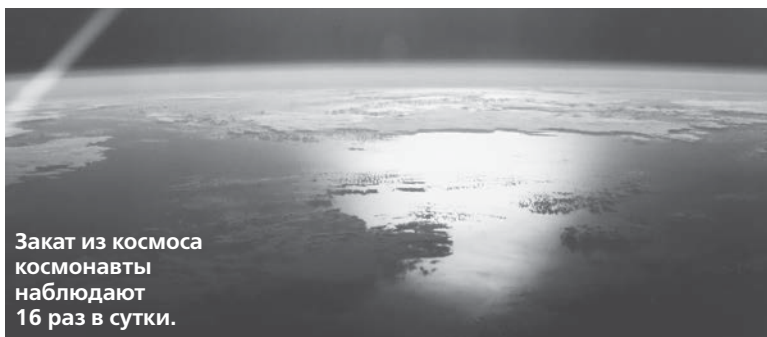
Закат из космоса космонавты наблюдают 16 раз в сутки.