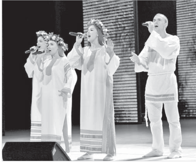
Вокальная студия «Арго», Ставропольский край.