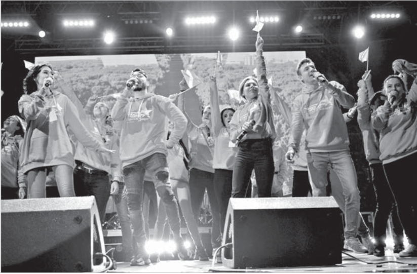
На церемонии открытия фестиваля.