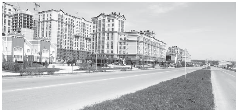
Современные дома вырастают в степи.