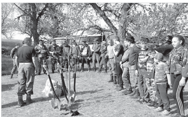
Постановка задач на проведение полевых работ. Хутор Дыдымкин, Ставропольский край, 2018 год.

Поисковые экспедиции на востоке Ставрополья проводились в начале 90-х учеными музея имени Прозрителева и Праве и курсантами Ставропольского высшего военного училища связи. Тогда еще были живы да и достаточно молоды свидетели периода оккупации и освобождения, много интересного рассказывали. И сейчас есть те, кто помнит или знает от родных. «Русские витязи», которые выезжают на Вахту памяти в восточные районы Ставрополья с 2018 года, несколько таких интересных рассказчиков встречали.