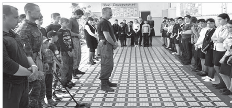
Встреча поисковиков ВПК «Русские витязи» со школьниками.

Строки из песни Михаила Ножкина, которая так и называется – «Точка опоры», просятся не только в заголовок к этому материалу.