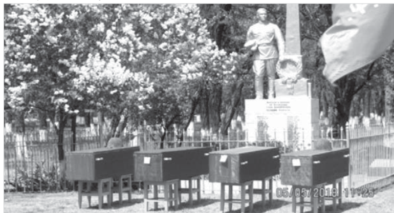
5 мая 2018 года останки двенадцати красноармейцев преданы земле в х. Дыдымкин в братской могиле.

Так вот, этот материал – о тех, кто эту точку опоры никогда не терял, кто помогал и помогает обрести ее молодым и совсем юным, которым только предстоит жить и Родине служить в условиях тотального противостояния со «спящим разумом» неблагодарных потомков европейцев, которых наши деды и прадеды спасли от «коричневой чумы».