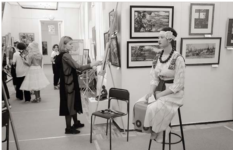
На площадке портретной живописи в музее изобразительного искусства.

Нынешний год – особенный. «Ночь музеев – 2021» проходила под девизом «Больше, чем музей» в условиях соблюдения необходимых мер безопасности в период распространения коронавирусной инфекции. Учитывая ситуацию, посетители уже научились с пониманием относиться к требованиям Роспотребнадзора