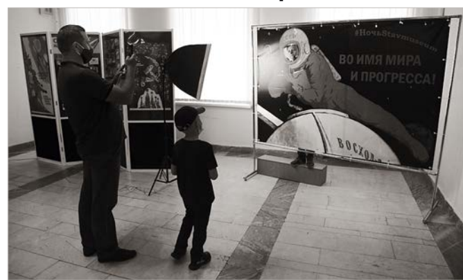
Космическая фотозона в Ставропольском музее-заповеднике.