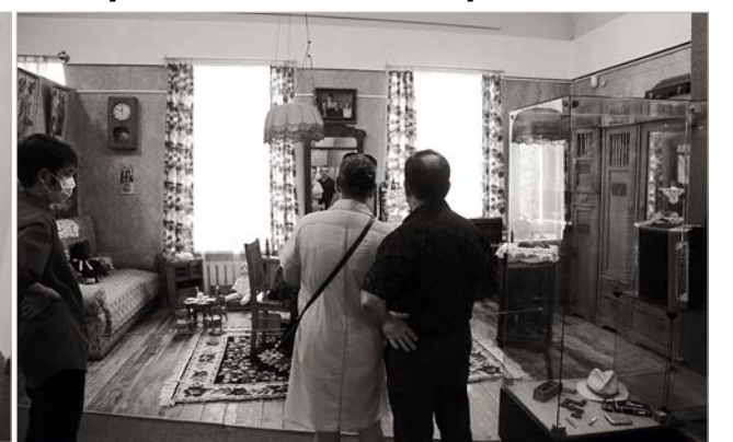
Если есть портал в прошлое, то его надо искать в музее.

Перелистать календарь и оказаться в 1961 году – такое под силу не только писателям-фантастам, но и музейщикам. На творческой площадке «Космос рядом» в зале