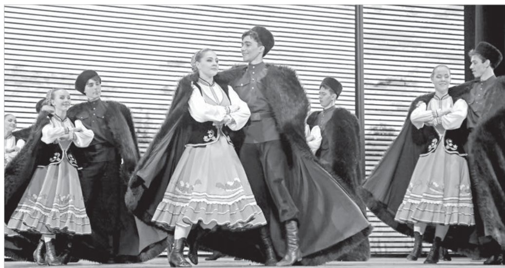
Казачья походная пляска.