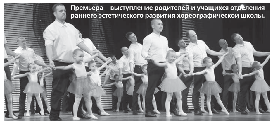
Премьера – выступление родителей и учащихся отделения раннего эстетического развития хореографической школы.