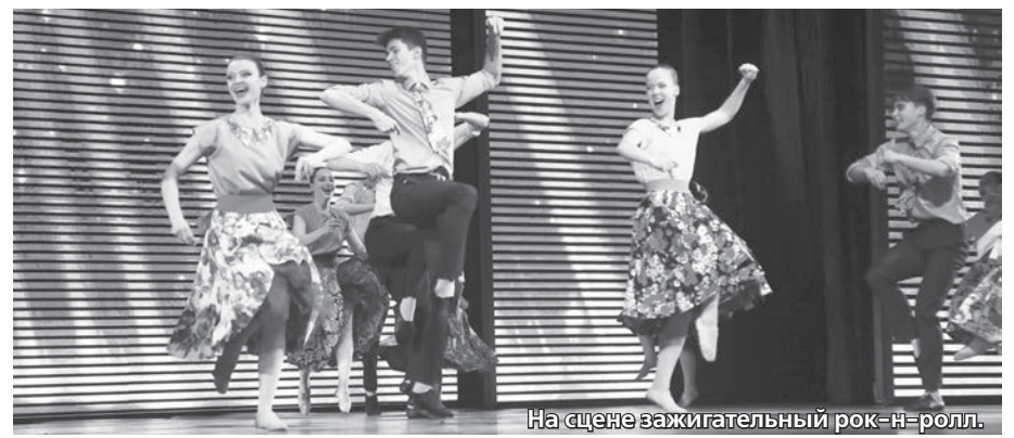
На сцене зажигательный рок-н-ролл.