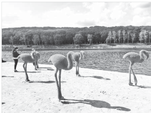
Любимые горожанам розовые фламинго.

рость – можно припарковаться на территории Пионерского пруда. В эту сторону днем, как рассказали сами отдыхающие, направляется меньше людей. Зато по вечерам все сезонный каток с искусственным покрытием пользуется большой популярностью. И здесь тоже есть места для отдыха, качели, тренажеры.