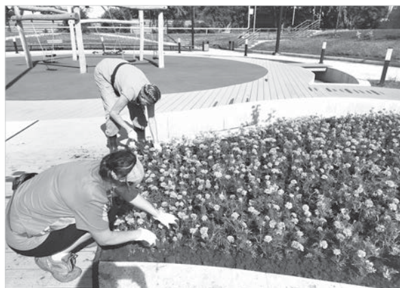
Сотрудники «Горзеленстрой» обустроили клумбы.