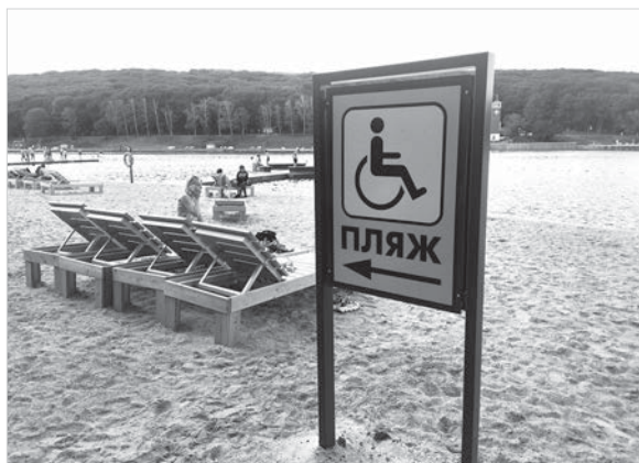
По всей территории – информационные указатели.