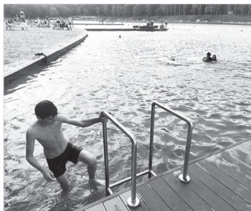
Первыми купальный сезон открыли дети.