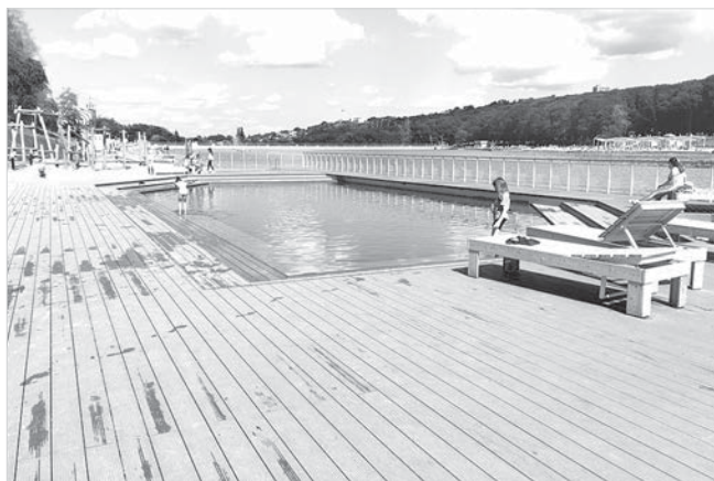
Для самых маленьких отдыхающих – отдельная территория.