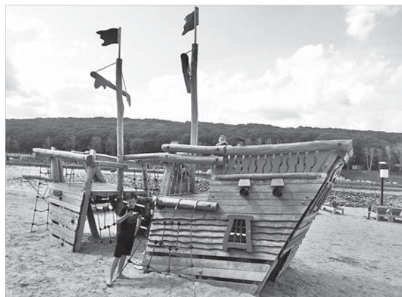
Юные «пираты Карибского моря» на своем корабле.