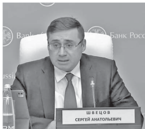
Первый заместитель председателя Банка России Сергей Швецов.

Нелегалы могут маскироваться под микрофинансовые структуры, брокерские конторы, другие фирмы, предоставляющие финансовые услуги. Как правило, главная их особенность – обещание хорошей и быстрой прибыли. Увы, поговорка о бесплатном сыре в мышеловке по-прежнему актуальна: еже-