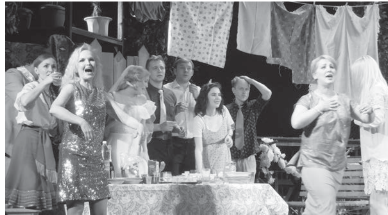
Сцена из спектакля-концерта «Наш дворик» (2018 год).