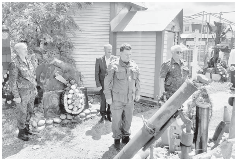
Возле часовни — Мемориально-исторический комплекс. Возложение цветов к памятникам героям крепости Бадабер и жертвам гражданской войны на Донбассе.

Радуется, что клуб «Русские витязи», более двадцати лет работающий на чистом энтузиазме,