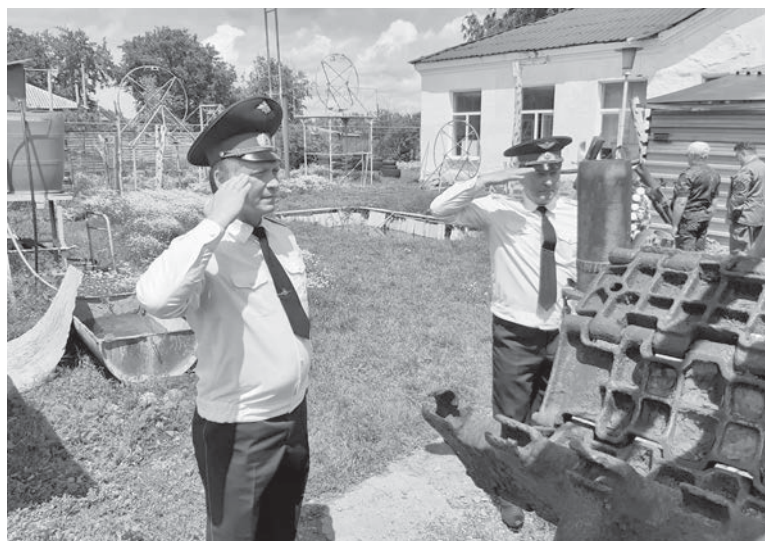
День памяти воинам ставропольских дивизий, погибшим в боях на Смоленщине. Памятник составлен из артефактов, найденных на месте боев осени 1941 года.

когда в первый раз оказался в гостях у «витязей», увидел базу, музей — дух захватило. Потому, когда узнал, что планируется выезд на Вахту памяти в восточные районы края и нужны согласования с Министерством обороны, был рад помочь.