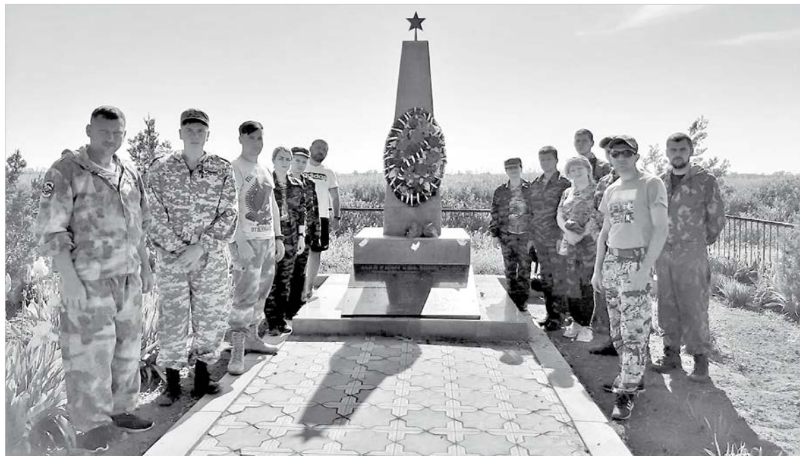
Участники Вахты памяти у обелиска погибшим воинам.

разрешения Минобороны РФ. В состав сводного отряда кроме поисковиков военно-патриотических клубов «Русские витязи» и «Гром» входили военнослужащие 247-го десантно-штурмового полка и 25-го полка специаль-