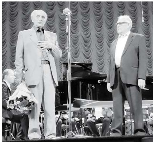
Поздравление от заслуженного артиста РФ Юрия Каспарова.