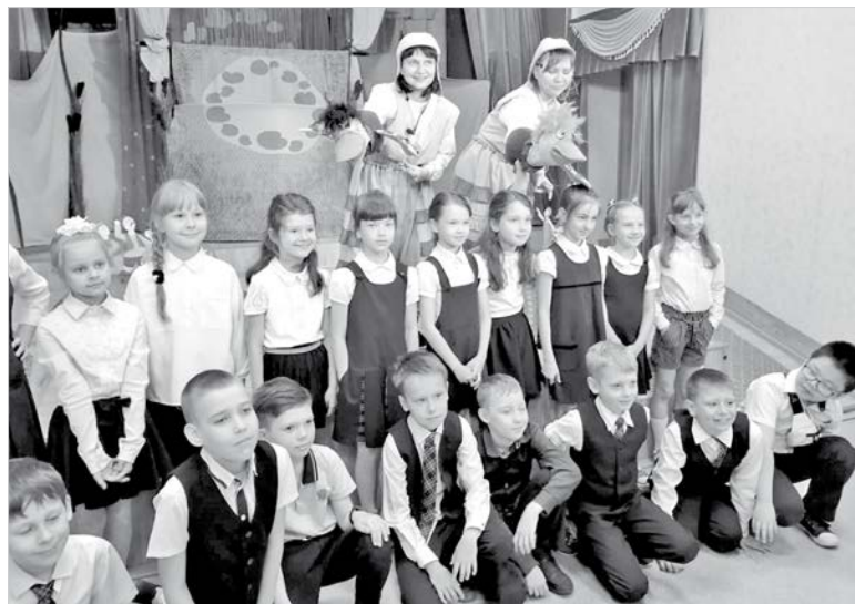
Фотография на память после спектакля.

В Новосибирске ставропольские куклольники выступали в «городе ученых» - Академгородке Сибирского отделения Рос-