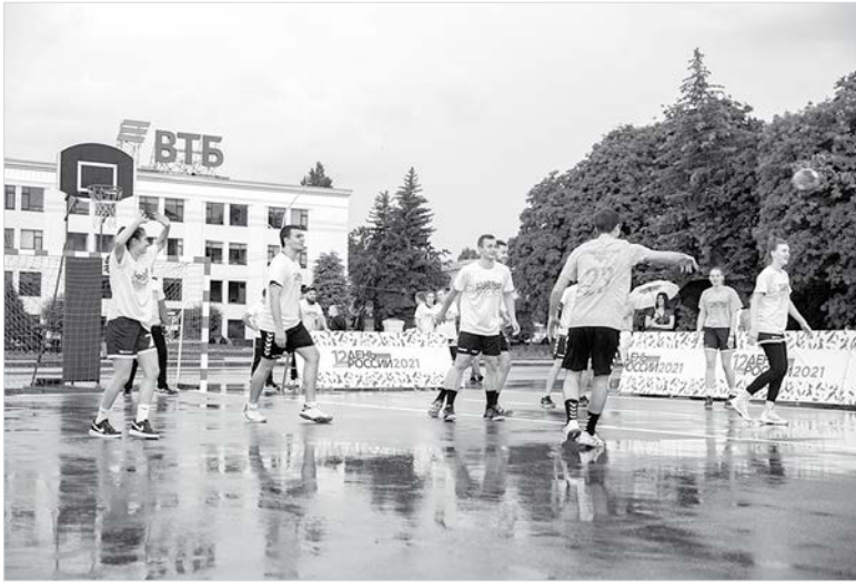
Матч под дождем.