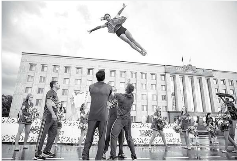
И радостный полет.