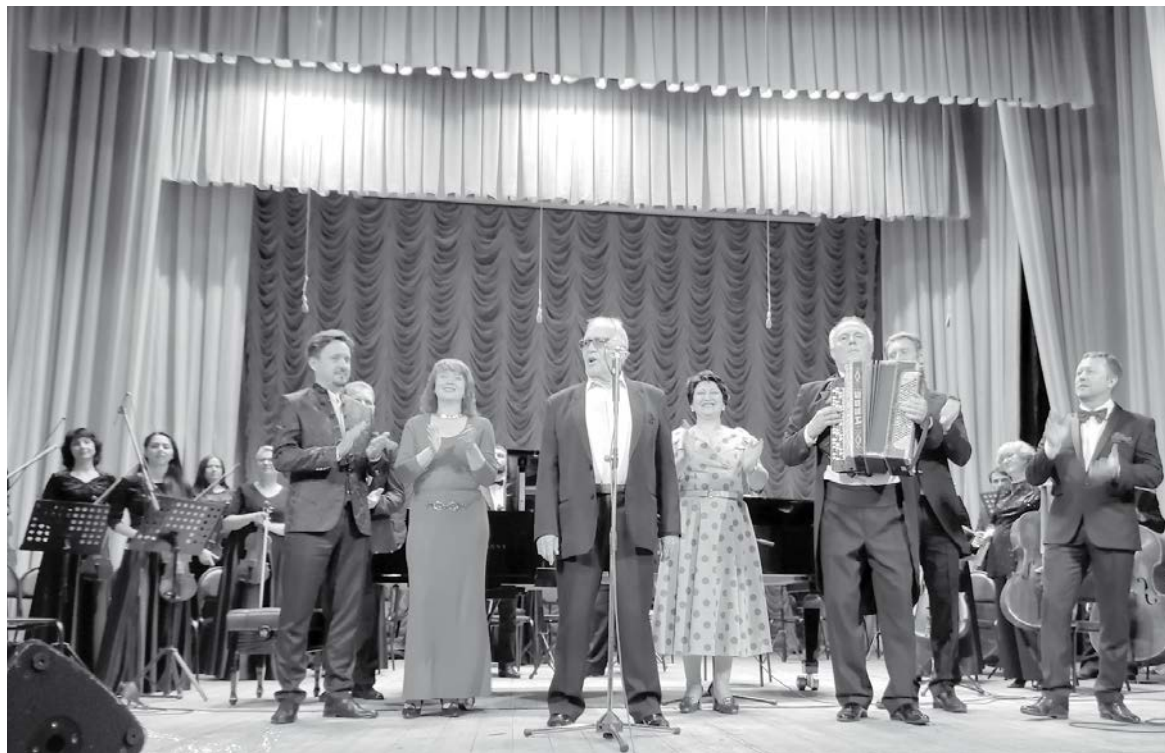
«Песне ты не скажешь до свиданья...».

В наши дни может показаться удивительным, что мальчик, в семье которого не было материального достатка, выбрал своей будущей профессией не какую-то «доходную» специальность, а пошел учиться в музыкальное училище. Но, видимо, так было