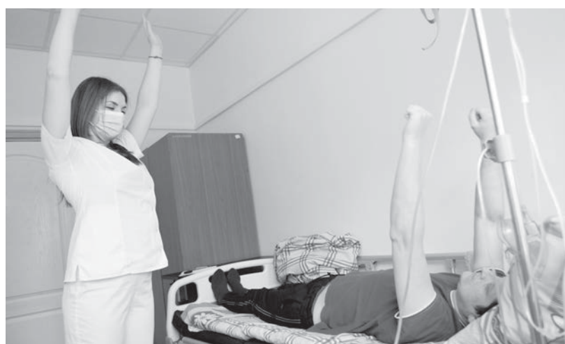
Инструктор ЛФК краевого реабилитационного центра проводит с пациентом дыхательную гимнастику прямо в палате.

- Именно. И, пользуясь случаем, хочу поздравить всех медицинских работников и свою семью с нашим профессиональным праздником. Желаю, чтобы белый халат оберегал от болезней не только вас, но и всех ваших родных и близких. Будьте всегда здоровы, радуйтесь жизни, и пусть поводов для радости будет неисчисляемое множество. Дарите людям здоровье, и доброта ваша вернется к вам душевной благодарностью. Успехов вам, благополучия в жизни и долгих лет профессиональной деятельности! С праздником, дорогие коллеги!