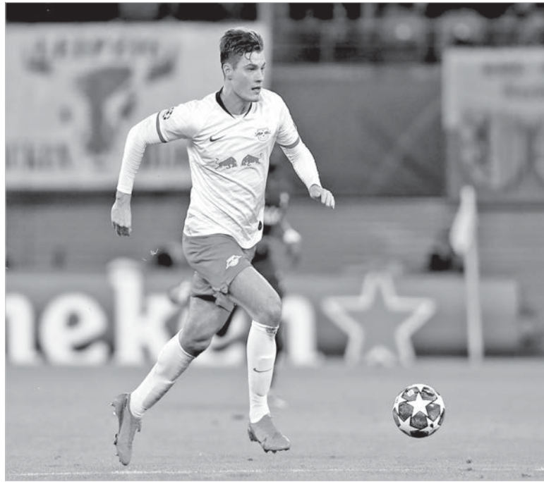
Патрик Шик — нападающий сборной Чехии и немецкого «Байера» — главный претендент на лучший гол чемпионата Европы.

Ну бог с ним, с турком! Многоопытный Матс Хуммельс отправил мяч в свои ворота, обеспечив победу сборной Франции над Германией со счетом 1:0.