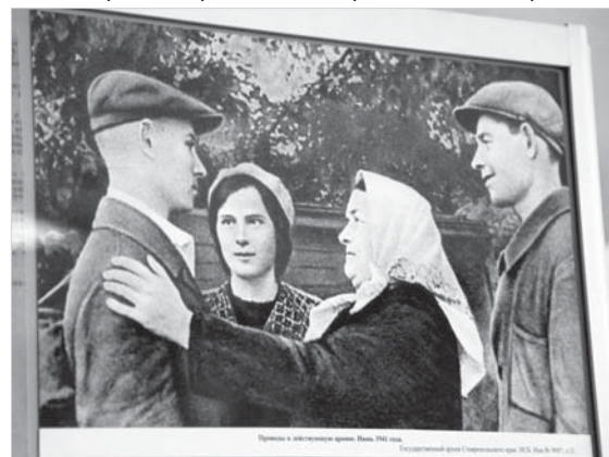
Проводы в действующую армию. Июнь 1941 года.

На выставке широко показаны документы о крупнейшей госпитальной базе страны, которая с начала войны была развернута в крае. К 20 августа 1941 года на базе санаториев и курортов Кавказских Минеральных Вод было открыто 47 госпиталей на 38034 койки. Всего же за годы войны через госпитальную базу Северо-Кавказского военного округа прошли 1 351 142 человека.