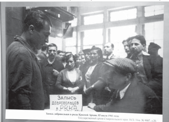
Запись добровольцев в ряды Красной Армии. Июль 1941 года (из фондов Ставропольского государственного архива Ставропольского края).