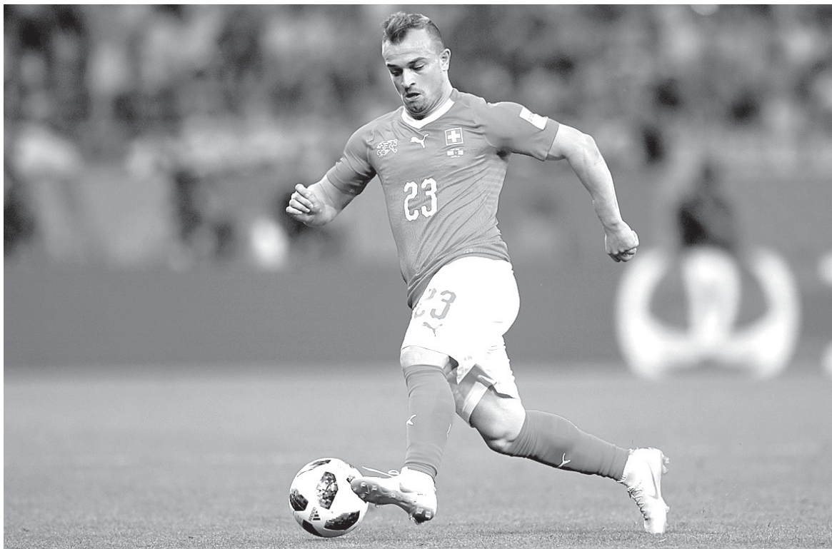
Шердан Шакири, сделавший дубль в матче сборных Швейцарии и Турции.

Добившись еще до перерыва комфортного перевеса в счете, швейцарцы дальше действовали по обстановке. В итоге соперники во втором тайме обменялись голами. У турок отличился Ир-