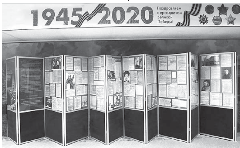
Выставка «Так началась война» в Государственном архиве Ставропольского края.

Были оперативно задействованы военно-учебные пункты для подготовки стрелков, радистов-операторов, телеграфистов и телефонистов, водителей и кавалеристов. На всех промышленных и сельхозпредприятиях организованы группы противовоздушной обороны. Трудовая мобилизация коснулась гражданского населения: тысячи ставропольцев работали на строительстве оборонительных сооружений.