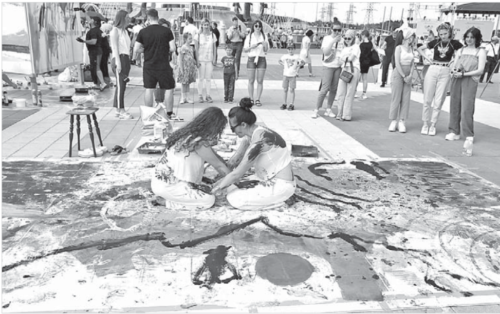
Перформанс «Свобода воли».