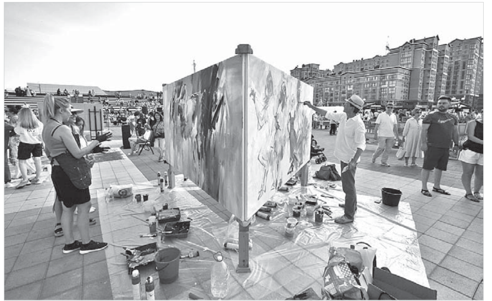
Площадь Святого князя Владимира превратилась в единое творческое пространство.