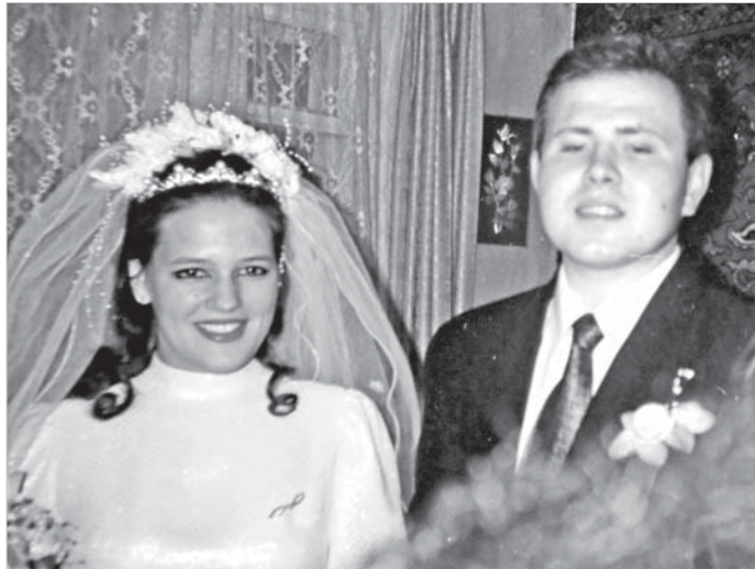
Свадьба, 2000 год. Самый счастливый день.