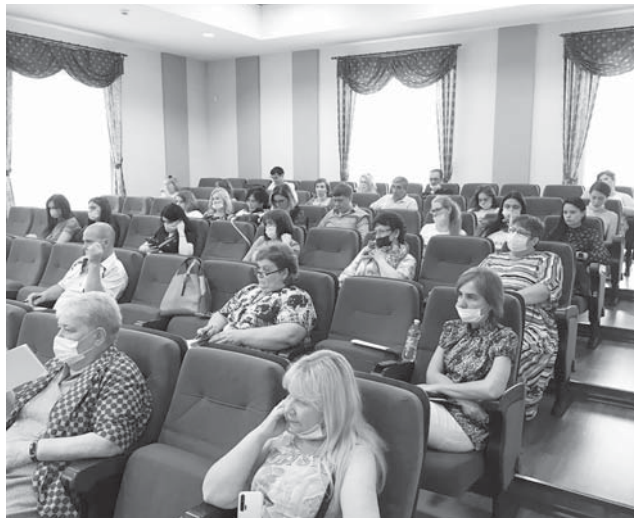
Семинар состоялся в арт-пространстве «Кислород» Ставропольской краевой научной библиотеки им. М.Ю. Лермонтова.

Мероприятие оказалось интересным для пишущей и снимающей братии разных рангов – сотрудников районных, городских, краевых и федеральных изданий, теле- и радиоконпаний. Конечно, тех представителей профессии, кто полностью посвятил себя правовой тематике в регионах, в том числе и в нашем, мало. Часто на это не хватает времени, ресурсов или образования.