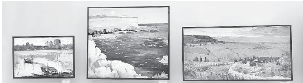
Пейзажи Петра Трегуба.

В выставочном зале Союза художников России молодые авторы из ряда российских регионов представили свои работы.