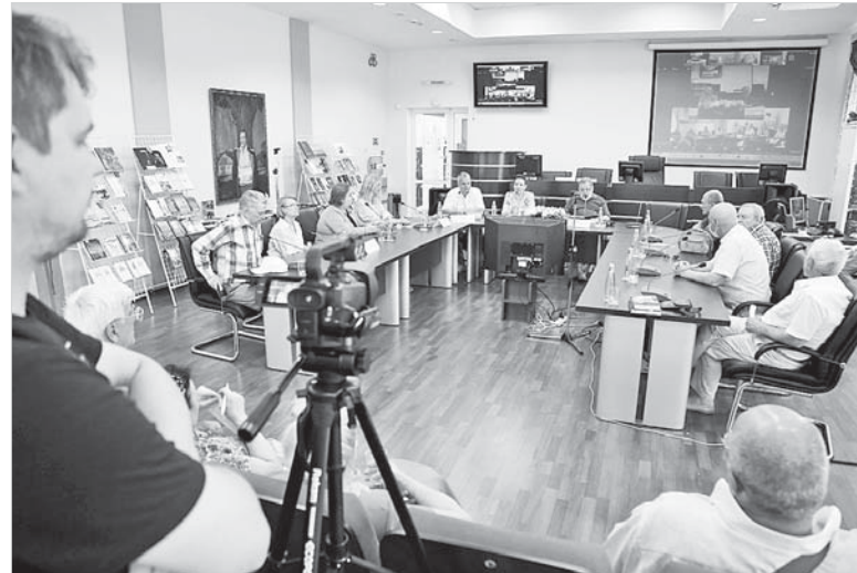
Участники форума «Белая акация» строят «Мосты дружбы».