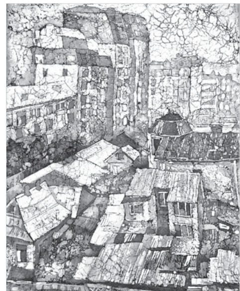
Г. Овчинникова. «Утро».

покупателя предметов изобразительного искусства. Регулярные выставки позволяют художникам воочию видеть работы других собратьев по цеху и вести профессиональный разговор на одном понятном профессиональному языку».