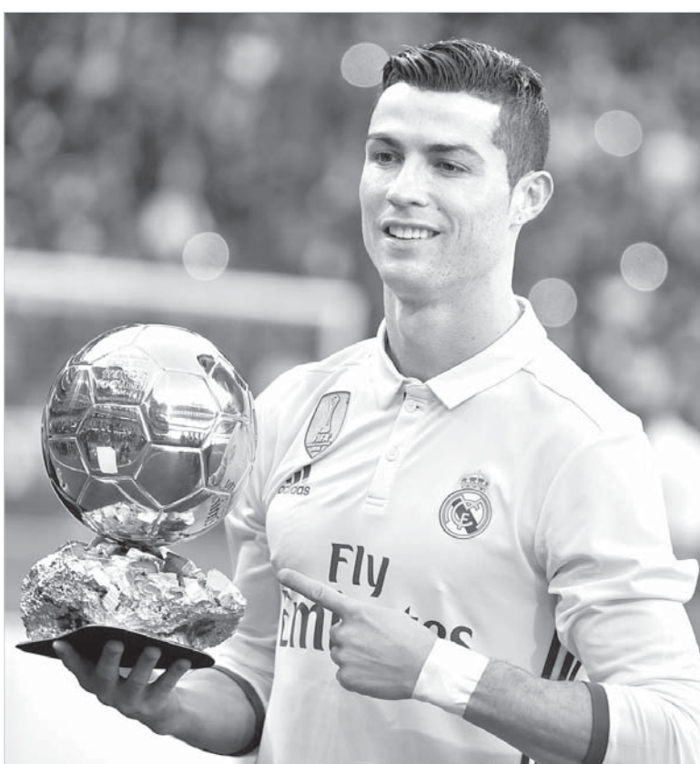
Лучший бомбардир чемпионата Европы Кристиану Роналду.

Специалисты довольно высоко оценивали шансы сборной Турции в этом турнире. Но вскоре назвали турок главным разочарованием чемпионата. Проиграв во всех своих поединках, турки первыми отправились домой.