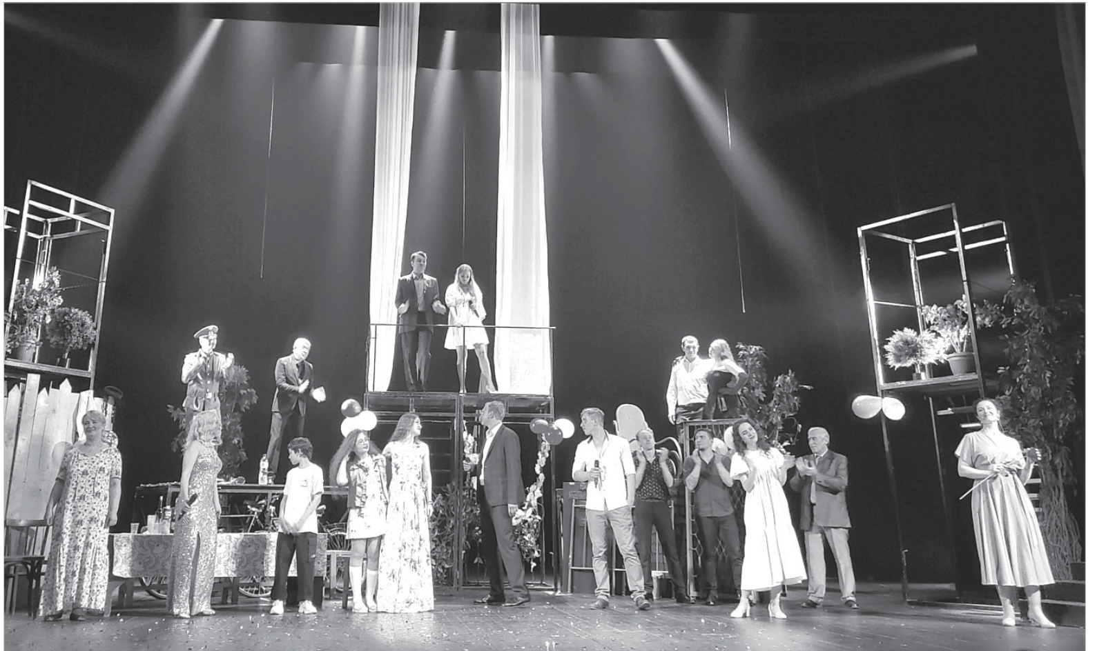
Финальная сцена из спектакля-концерта «Наш дворик».

Собирательный образ дворика, где развиваются события, географически не привязан к определенному городу. Правда, ощущается южный колорит. Можно уловить черты Одессы и Ялты.