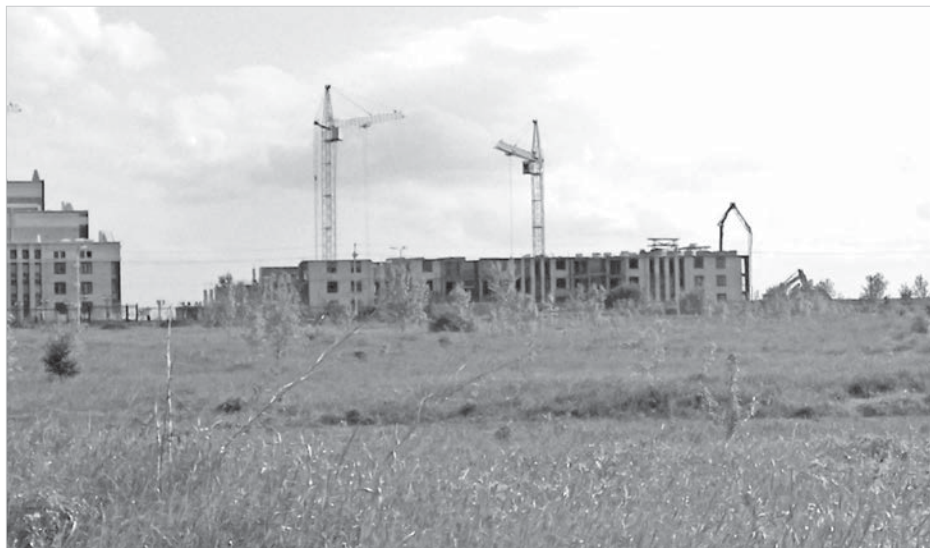
Строительство — опора экономики.