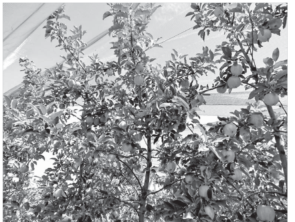
Эксперимент по развитию садоводства в личных подсобных хозяйствах Ставрополя признан удачным.