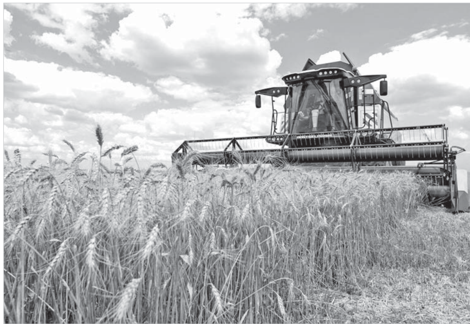
Уборочная страда – 2021 на Ставрополье завершена.

По итогам 2020 года Ставропольский край экспортировал более одного миллиона тонн агропромышленной продукции на общую сумму 405,98 млн долларов США. Этот показатель вырос на 13,4% в сравнении с 2019 годом. Основное соотношение вези со странами дальнего зарубежья. Стоит отметить, что номенк-