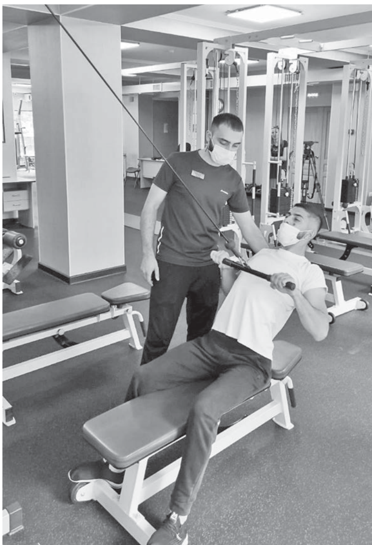
Центр доктора Бубновского на КМВ.

Медицинский реабилитационный центр доктора Бубновского на Кавказских Минеральных Водах работает с пациентами в системе обязательного медицинского страхования. Медучреждение оказывает полный комплекс реабилитационных услуг для жителей края. Бесплатную реабилитацию здесь можно пройти по таким направлениям, как травматология, неврология, кардиология. С 2020 года Центр оказывает поддержку людям, которые перенесли корона-