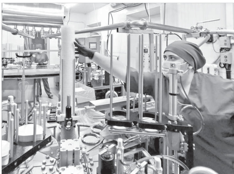
На пятигорском предприятии «Русмолоко».

В рамках регионального проекта Фонду поддержки предпринимательства передается имущественный взнос для обеспечения доступа субъектов малого и среднего бизнеса к экспортной поддержке и оказанию комплексных услуг в этом направлении. Государственному унитарному предприятию «Гарантийный фонд поддержки субъектов малого и среднего предпринимательства в Ставропольском крае» предоставляется региональная субсидия. Еще один имущественный взнос направляется некоммерческой организации «Фонд микрофинансирования субъектов малого и среднего предпринимательства в Ставропольском крае» в целях предоставления на льготных условиях микрозаймов субъектам МСП. Кроме того, министерством сельского хозяйства Ставропольского края создается система поддержки фермеров и развития сельскохозяйственной кооперации.