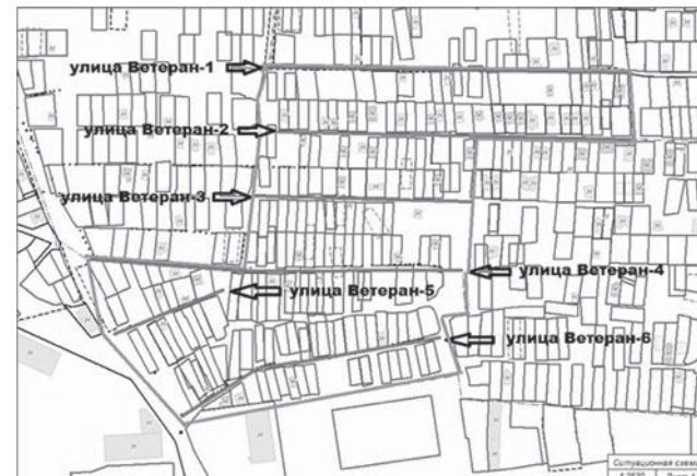
СХЕМА улицы Ветеран - 1, улицы Ветеран - 2, улицы Ветеран - 3, улицы Ветеран - 4, улицы Ветеран - 5, улицы Ветеран - 6, расположенных в садоводческом некоммерческом товариществе «Ветеран» Октябрьского района города Ставрополя городского округа города Ставрополя Ставропольского края Российской Федерации

Первый заместитель главы администрации города Ставрополя Д.Ю. Семёнов