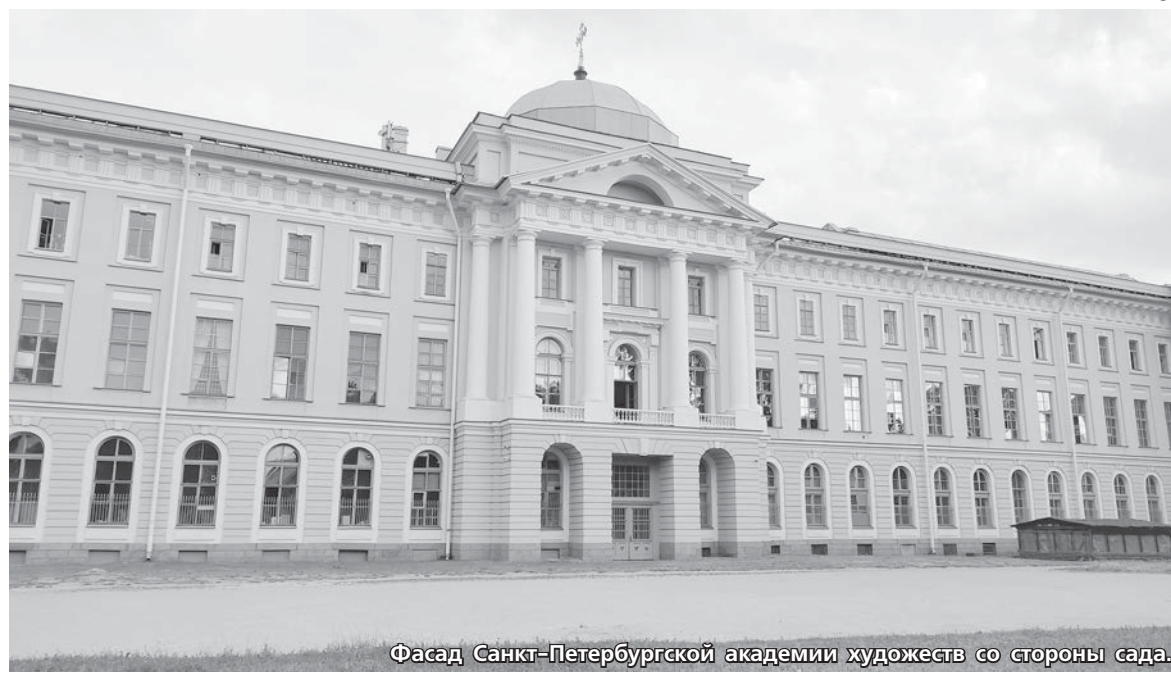
Фасад Санкт-Петербургской академии художеств со стороны сада.