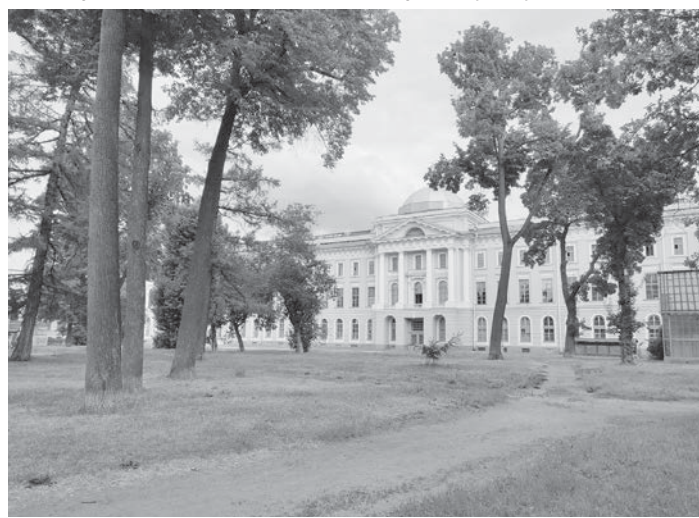
В Академическом саду.