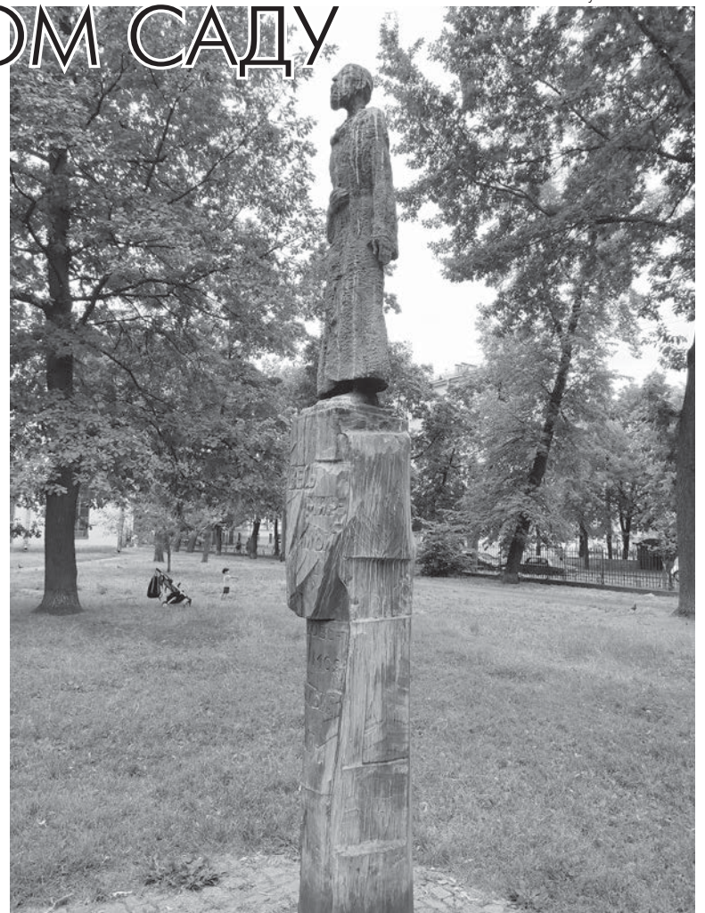
Памятник Коста Хетагурову в саду Санкт-Петербургской академии художеств имени И.Е. Репина (скульптор Владимир Соскиев).

Но это было и время больших испытаний для молодого художника. Коста жил в окружении архитектурного великолепия Северной столицы, созерцал шедевры живописи и скульптуры, но при этом испытывал большие материальные трудности. «Коста буквально голодал, терпя всякие лишения, старательно скрывая от всех свое ужасное положение,