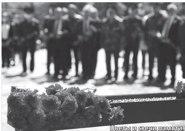
Цветы и свечи памяти.