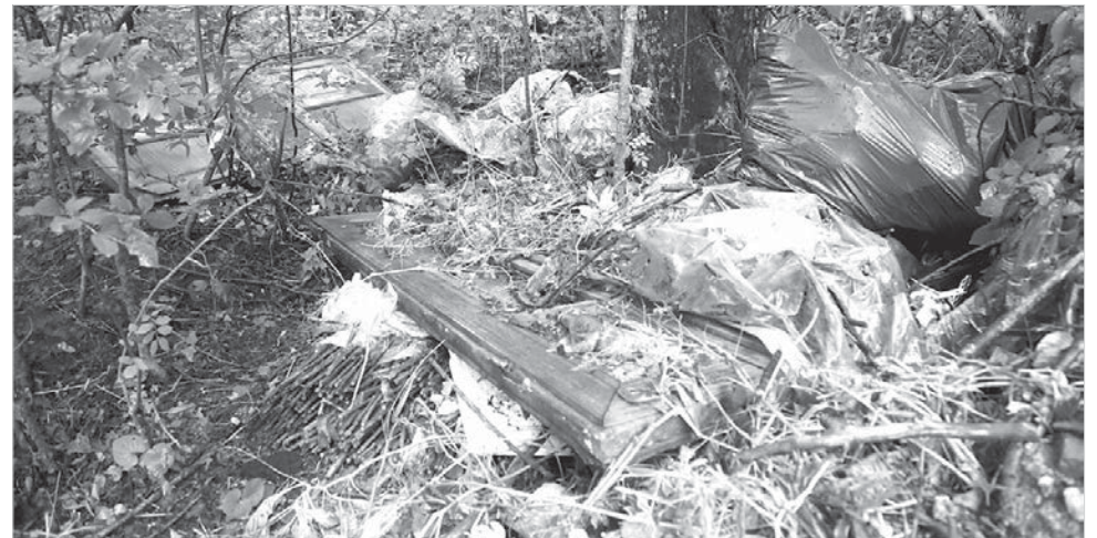
Участок для будущей школы пока еще сильно захламен.