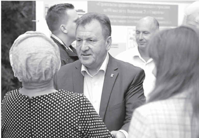
Встреча главы Ставрополя с жителями улицы Федеральной.

Жители Северо-Западного района собрались на встречу с главой Ставрополя Иваном Ульянченко, чтобы обсудить необходимость строительства школы в микрорайоне «Зеленая роща». Напомним, на улице Федеральной, 25, запланировано строительство большой школы почти на тысячу мест, которая сможет решить проблему перегрузки общеобразовательных учреждений района, более того, будет находиться в шаговой доступности для многих детей, живущих здесь.