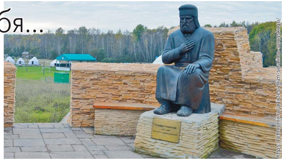
Фрагмент Скульптурной композиции «Четыре мудреца». Калужская область, Боровский район, деревня Петрово.

Одна наша занимающаяся в Академии здоровья рассказала, как была свидетелем землетрясения в Туркмении. Она работала на ж.-д. станции, когда начались толчки, им приказали срочно покинуть помещения, отойти от здания и лечь на землю. Так вот, лежа она услышала подобие детского плача, всхлипывания и буквально стона, которые предвещали земные колебания. Так ведь Земля – живая сущность, у нее свои жизненные приоритеты, но и она способ-