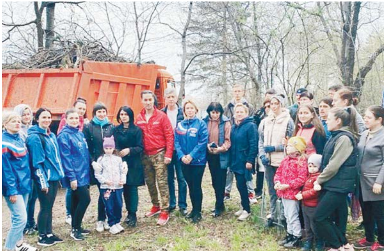
Начало на 1-й стр.