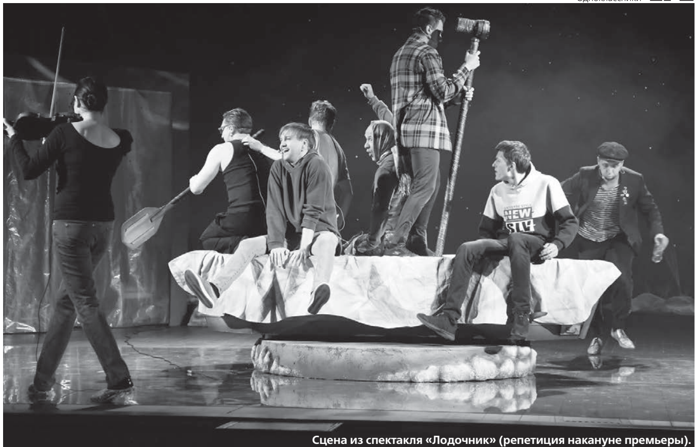
Сцена из спектакля «Лодочник» (репетиция накануне премьеры).