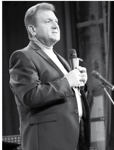
Глава Ставрополя Иван Ульянченко: «Спасибо Михаилу Юрьевичу, что был рядом с нами».

Немало в Ставрополе ценителей мастерства камерного хора государственной филармонии, которым руководит главный хормей-