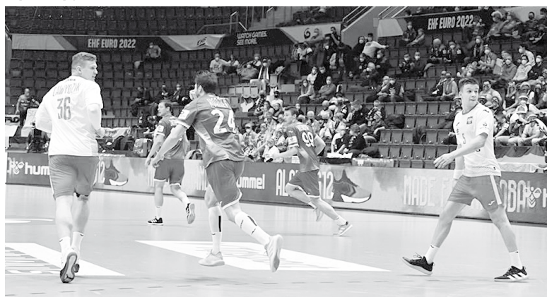
Матч Россия – Польша.