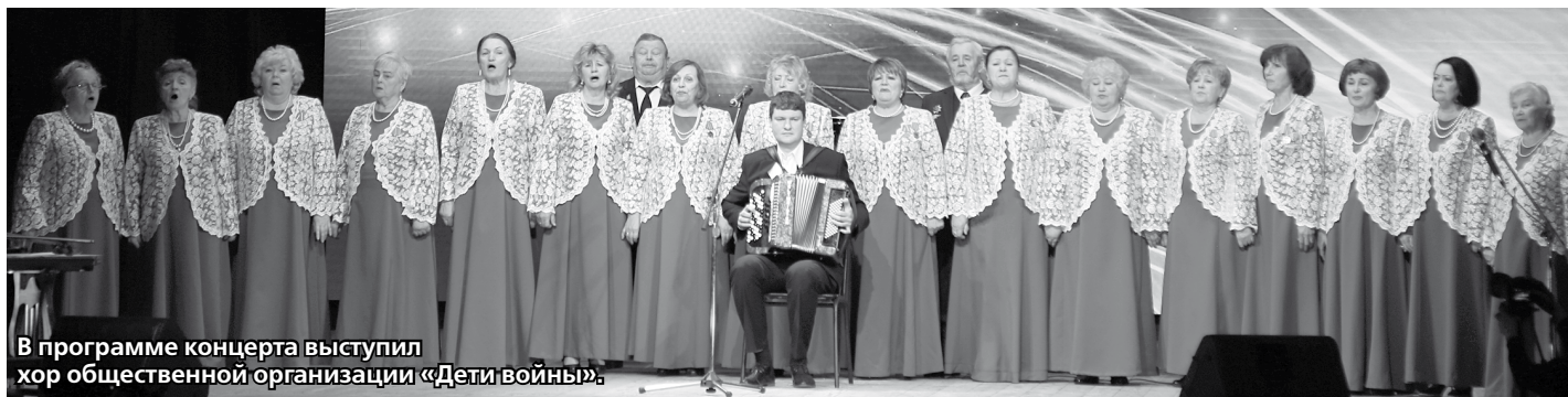
В программе концерта выступил хор общественной организации «Дети войны».