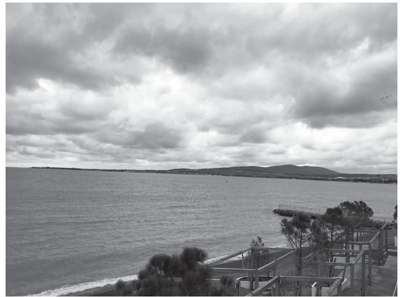
Хмурое небо над бухтой.

На набережную так или иначе можно попасть из любой точки курорта, двигаясь пешком или на транспорте. Так уж спроектирован город, буквально опоясывающий красивую бухту. Мы находились в центре, и здесь было что посмотреть. На улице Островского находится сквер Хильдесхайма – немецкого города-побратима Геленджика, где установлен трехметровый арт-объект «Башенки-побратимы», оформленный в классическом стиле немецкой архитектуры. На одной из них изображён герб Геленджика, на другой – города Хильдесхайма. Недалеко есть и сквер Нетания, заложенный в честь дружбы с этим израильским городом, на территории которого высажены редкие деревья, а рядом установлены таблички с их описанием. Немного дальше расположен океанариум и оборудованы красивые детские площадки «Лимпопо», «Золотая рыбка» и «Город Сказок». Детей, которым, родите-