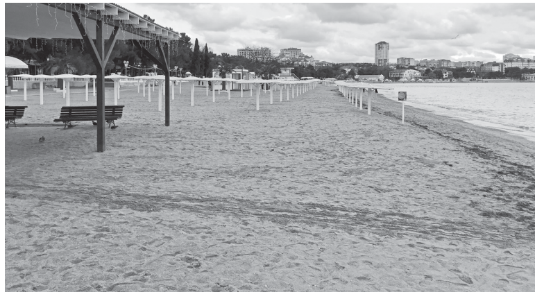
Центральный городской пляж Геленджика зимой.

Из главных плюсов нашего места отдыха – небольшое расстояние до набережной и открытый бассейн с подогревом воды до 30 градусов и выше. Последний фактор, учитывая не слишком благоприятную погоду, был очень кстати. А вот с парковкой, которую нам обещала система интернет-бронирования, вышла несостыковка. То есть она была, причём недалеко, но за деньги. Триста рублей в день для двух суток пребывания – сумма не критичная, но более продолжительный отдых может существенно ударить по карману туристов. В этой связи мой совет потенциальным путешественникам заключается в том, что не стоит во всём полагаться на указанные на интернет-сервисе условия, а лучше созвониться с гостиницей напрямую. Мы спешили, заказывая номер 31 декабря всего за несколько часов до Нового года, поэтому и были издержки.