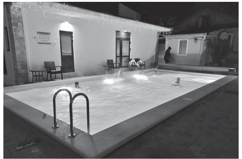
Тёплый открытый бассейн в отеле.

ли решили показать зимний Геленджик, мы увидели очень много.